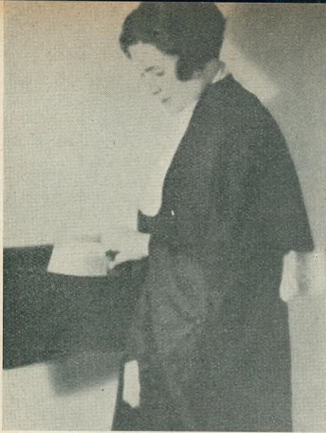
Förf. iförd den franska advokatdrükten.

V ÅRA UTLÄNDSKA VÄNNER förvåna sig ofta över att vi fransyskor ännu inte tillkämpat oss vår rösträtt. De förstå det så mycket mindre som Frankrike ju är ett av våra äldsta demokratiska länder. De skjuta skulden än på våra politiker och än på vår egen slapphet och även om de inte förväxla oss med de unga ytliga dockor, som exporterats genom vissa franska romaner — ty de mena väl med oss — så anse de nog ändå, att vi föra vår kamp med otillräcklig kraft.