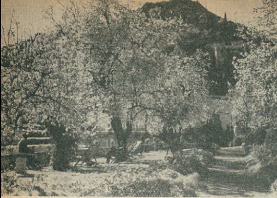
Nu blomma mandelträden i Taormina ..