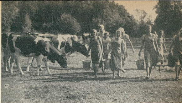
”På morgnarna och kvällarna skulle de mjölka korna”.

En fråga, som naturligtvis hör till de mest svårknäckta, är ledarfrågan. Men redan första året, innan dessa hem öppnats, hade i 36 olika »Schulungslager» bland 4.000 sökande 1.400 ledare och le-