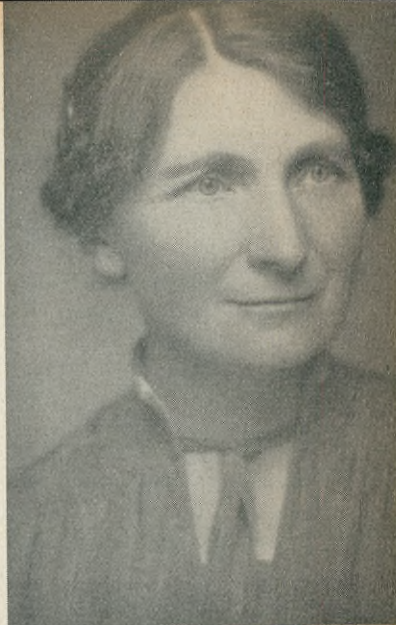
Emilia Fogelklou- Norlind.

helst lagstiftningsförsök och som mången just därför sällan kan upptäcka. Hon har blivit kvinnomedvetandets tolk inom den svenska psykologien; därför att hon inte nöjt sig med att konstatera den kvinnliga mindervärdekänslans lidande, utan även trängt sig fram till dess motsvarighet — mindervärdekänslan hos männen. Hon har lagt fingret på en ömtålig punkt hos det nutida manliga själslivet, när hon om Birgittas biktäder och sekreterare på 1300-talet säger: "Det föll dem aldrig in att tvivla på hennes ingivelsers värde, av det skälet att hon var kvinna och att de, som själva blivit satta i rörelse genom hennes budskap voro män. De vore ju inga andens fattighjon de heller, så att de kunde räkna en annans rikedom som stöld från dem sjäva."