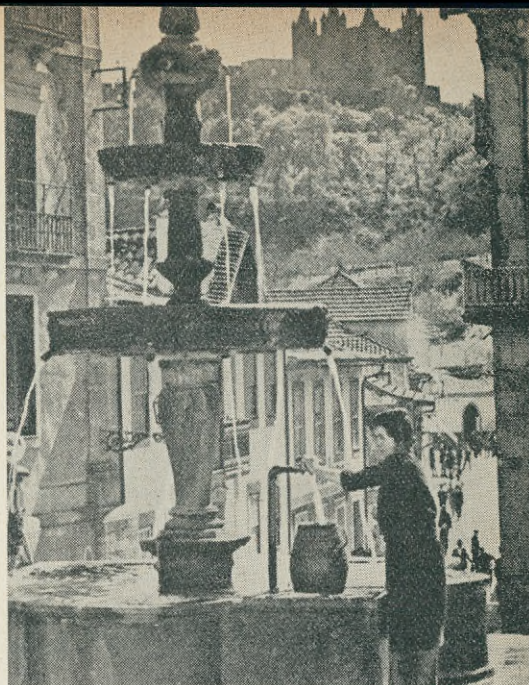
Kvinnan vid brunnen, bild från den lilla staden Feira.

Vi foro genom små städer och byar, som gjorde intryck av att ha dröjt sig kvar från en svunnen tid. Vid de vackra brunnarna hämtade kvinnorna ännu vatten i sina stora krukor, som de