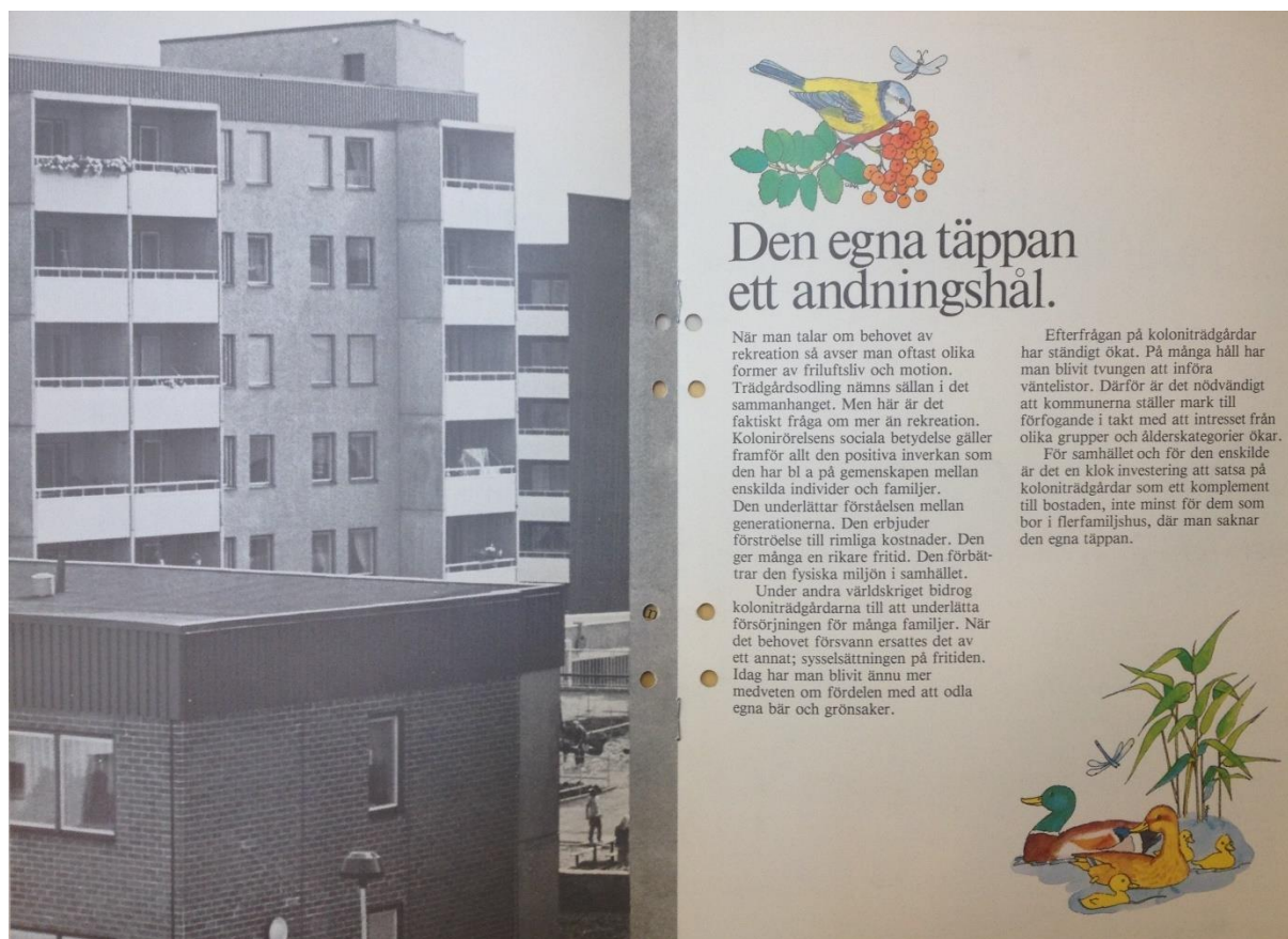
Figur 2. I arbetet med att bilda opinion har kolonirörelsen velat framställa sig själva som en motbild till den genomplanerade och livlösa betongstaden. Broschyr framtagen av Svenska förbundet för koloniträdgårdar och fritidsbyar och HSB.