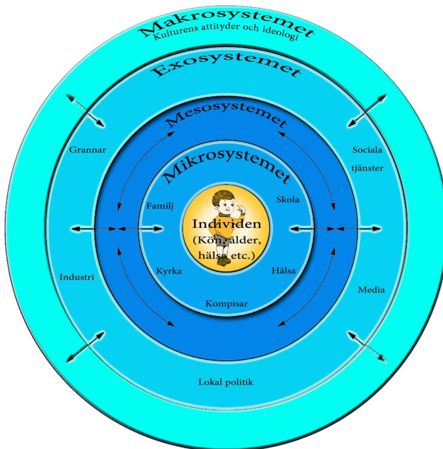
Bronfenbrenners Ekologiska utvecklingsteori (Egen grafik)

I uppsatsen vill jag visa att könsrelationerna i klassrummet är beroende av de olika relationerna i skolkorridorerna, skolgården, fritiden och hemmet. Skolan kan göra en viktig sak, dvs att arbeta med att förbättra relationerna till elevernas hem, så att även föräldrar (som inte går i skolan) förstår vad skolan menar med jämställdhet. För detta ändamål är det nödvändigt att använda teorin om Bronfenbrenners ekologiska system (Leonard, 2011).