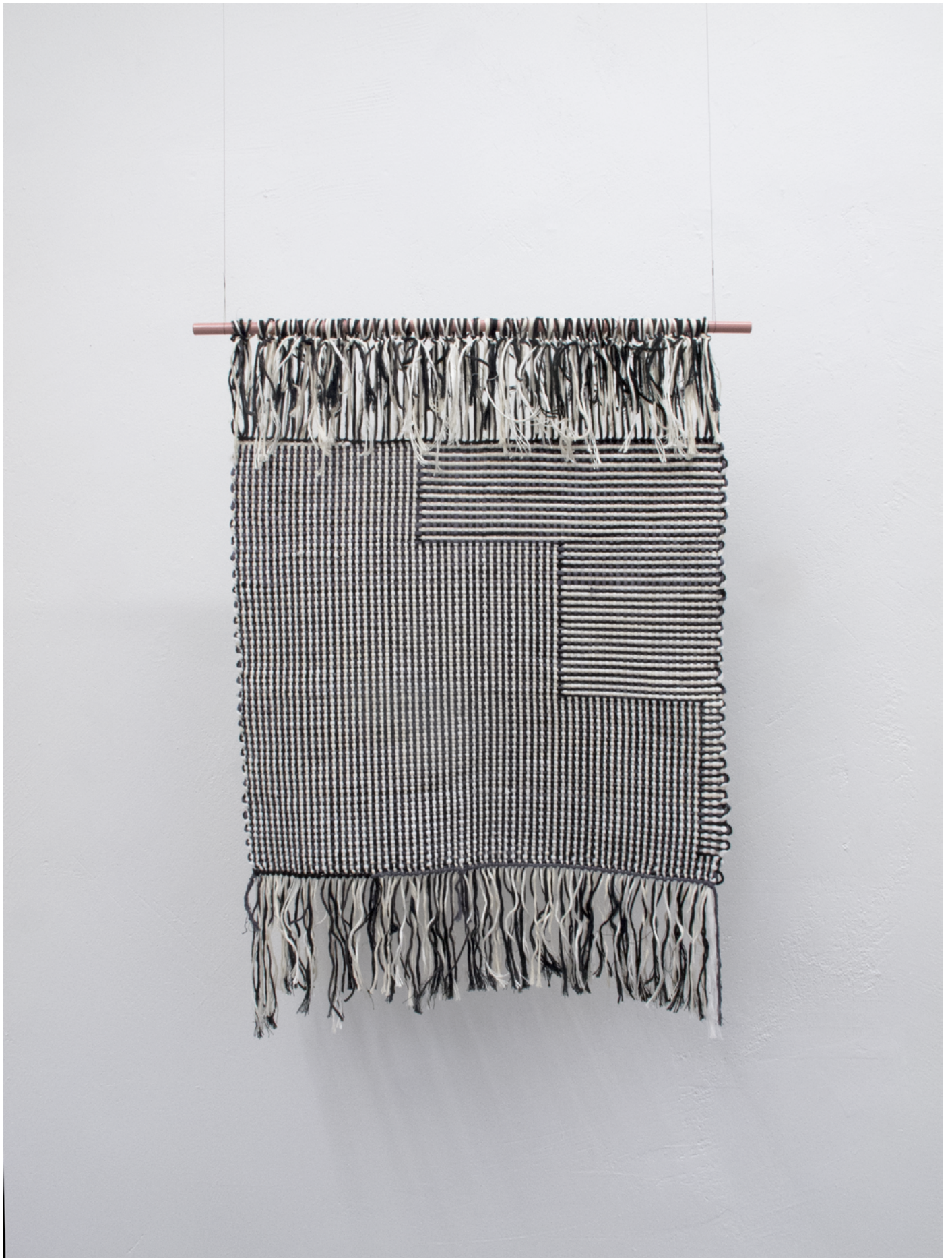
Cutout, 2019 bomull, lin, polyester, nylon 67 x 100 cm