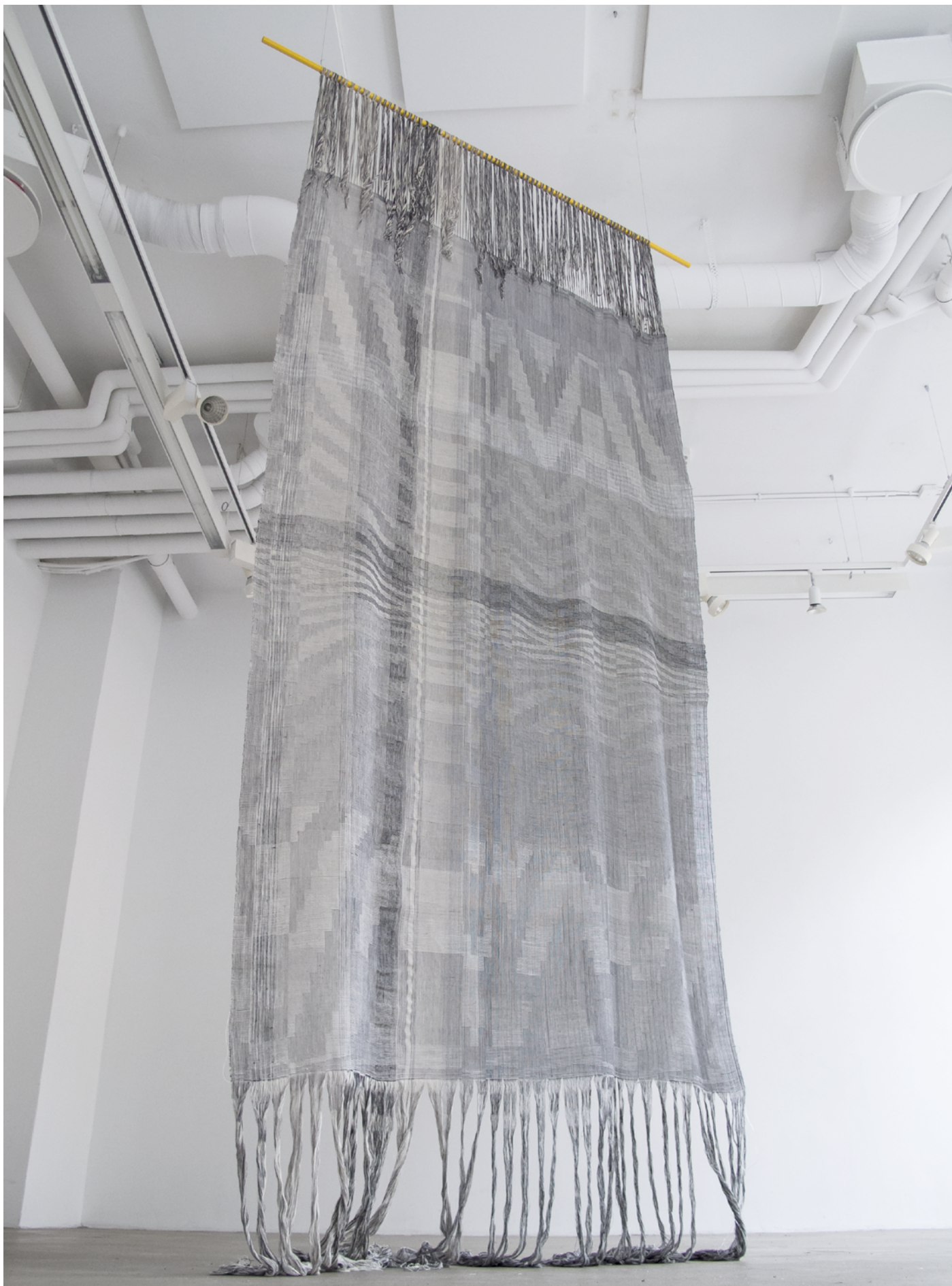
Utan titel, 2019 ull, lin, bomull, nylon, silke 119 x 300 cm