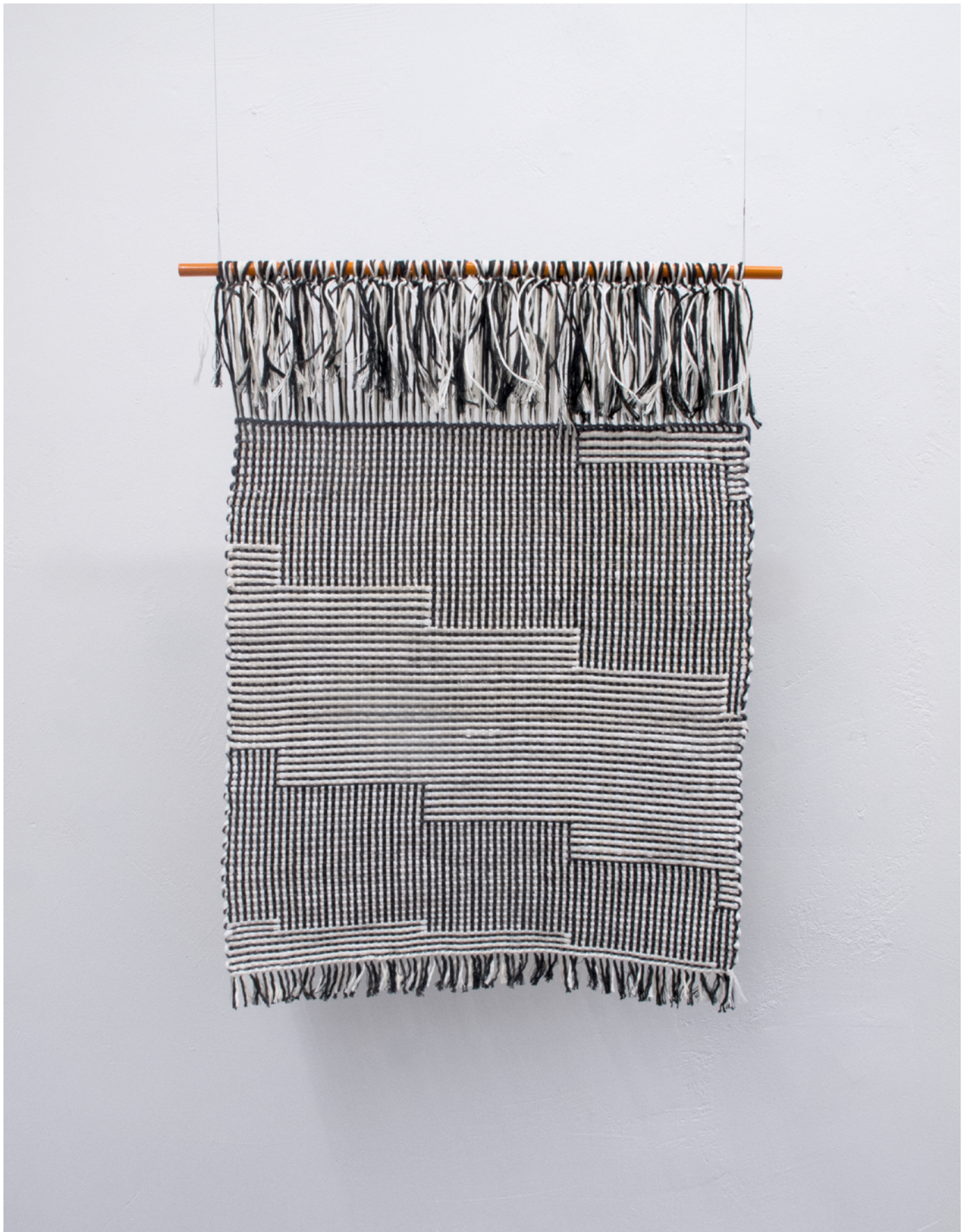
Detail (one half), 2019 bomull, lin, polyester 69 x 97 cm