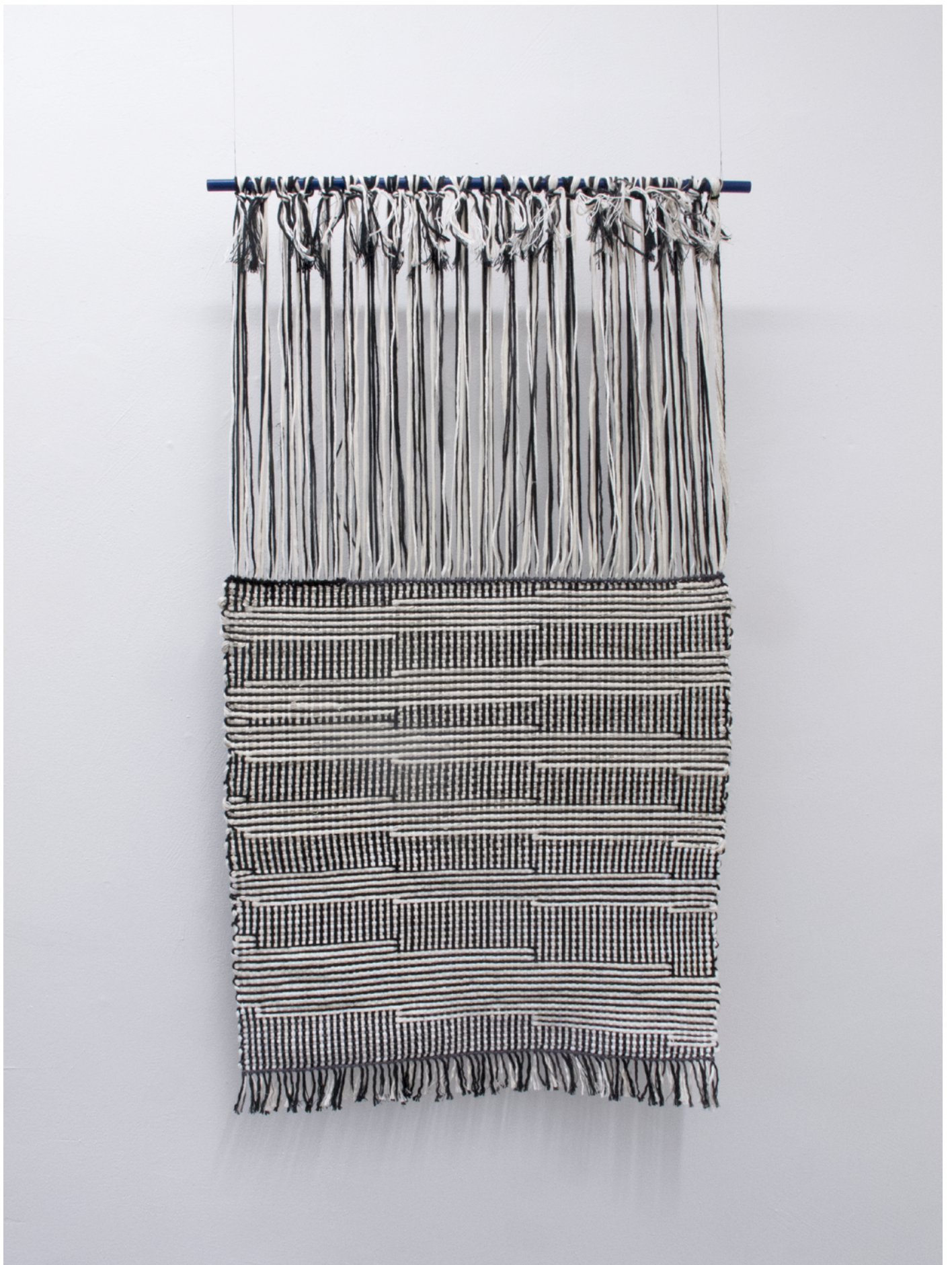
Detailil (the other), 2019 bomull, lin, polyester 71 x 131 cm