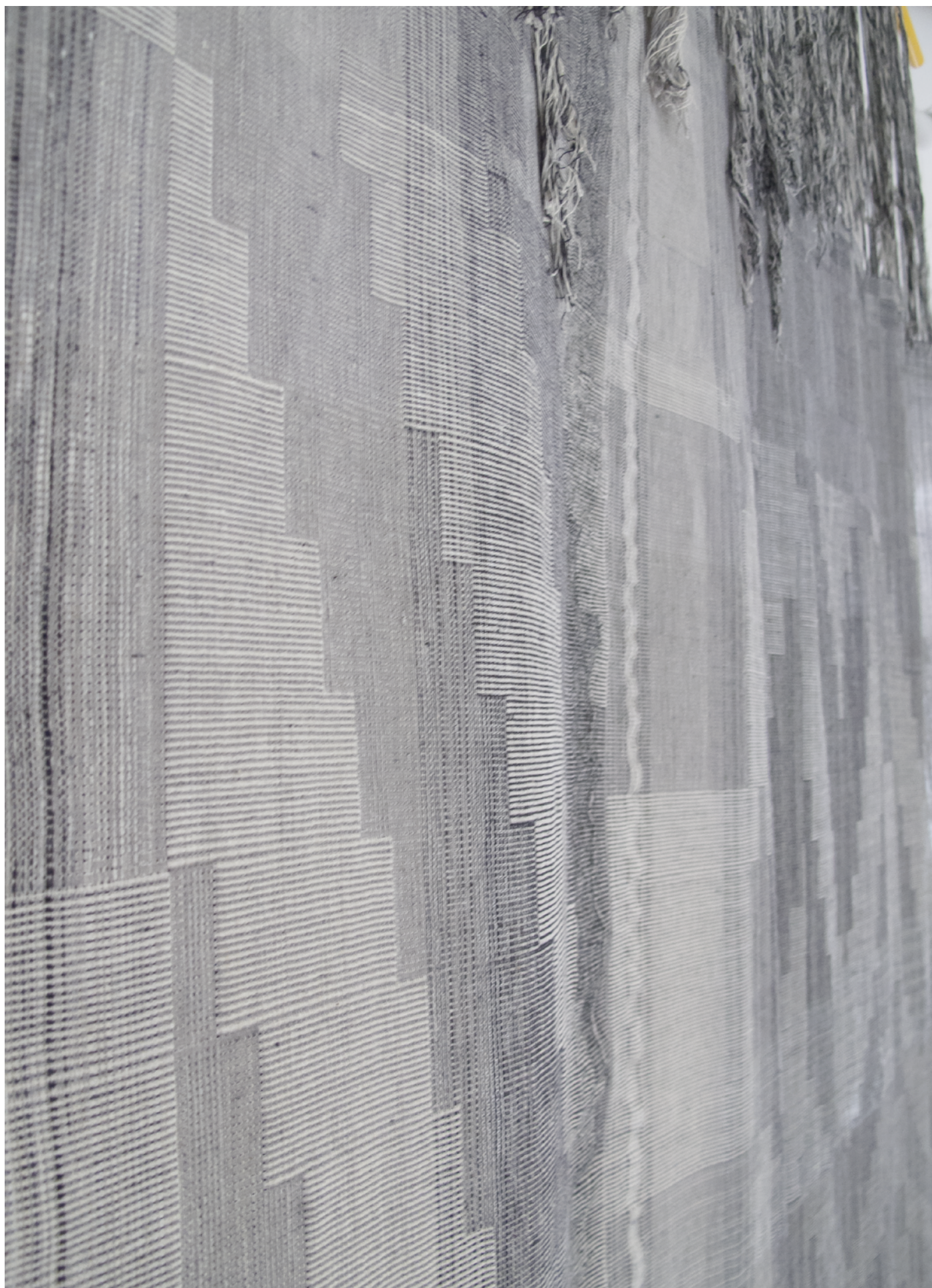
Utan titel, 2019 - detalj ull, lin, bomull, nylon, silke 119 x 300 cm