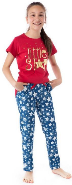
Bild 9.