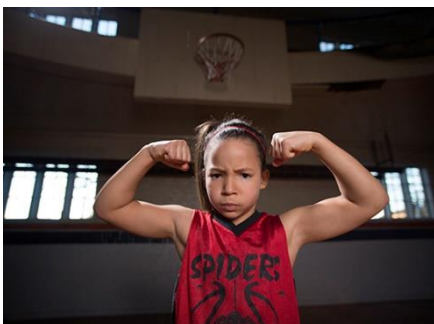
Bild 8.