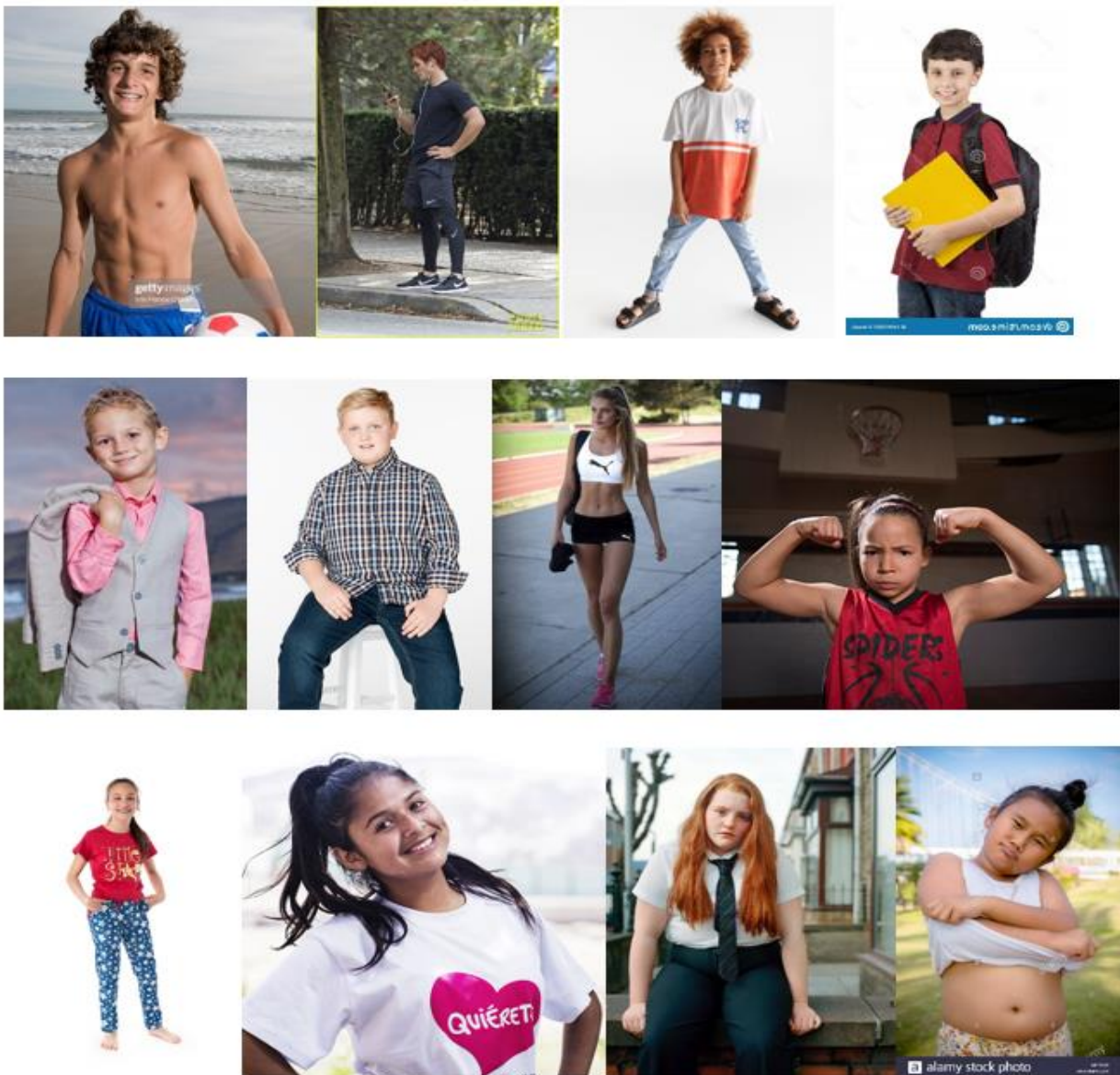
Figur 2. Kopia på de bilder som användes i rekonstruktionen. Bilderna är i numerisk ordning (bild nr 1–12 läst uppifrån och ner, vänster till höger). För fullständig källhänvisning, se bilaga 3.

För att få svar på hur elever resonerar om undervisningens innehåll för att se om innehållet främst är anpassat för flickor eller pojkar så användes en rekonstruktion med hjälp av bilder (figur 2). Utifrån det empiriska materialet så dök följande teman upp: (i) På pojkarnas planhalva samt (ii) föreställningar om pojkar och flickor; isärhållning och rangordning .