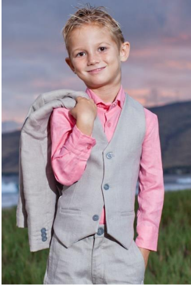
Bild 5.