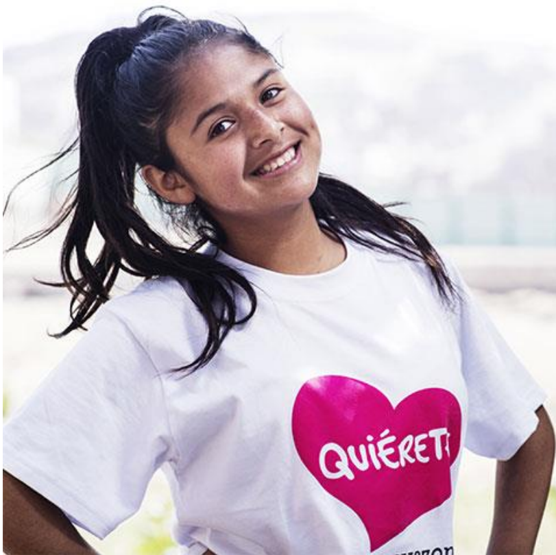
Bild 10. Tillgänglig: https://stories.plancanada.ca/in-photos-love-yourself-art-project-empowers-girls-in-peru/?_ga=2.25075834.1968112958.1576436045-969601597.1576436045