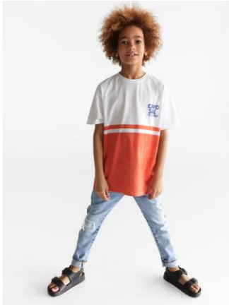
Bild 3.