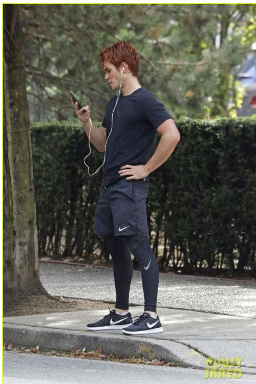
Bild 2.