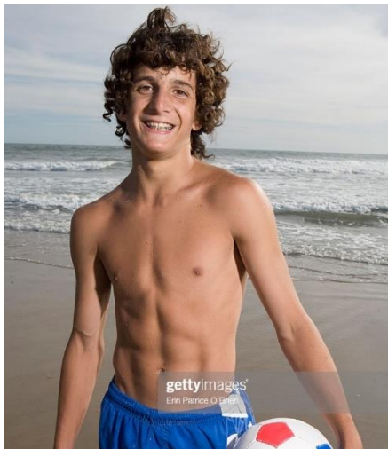
Bild 1.