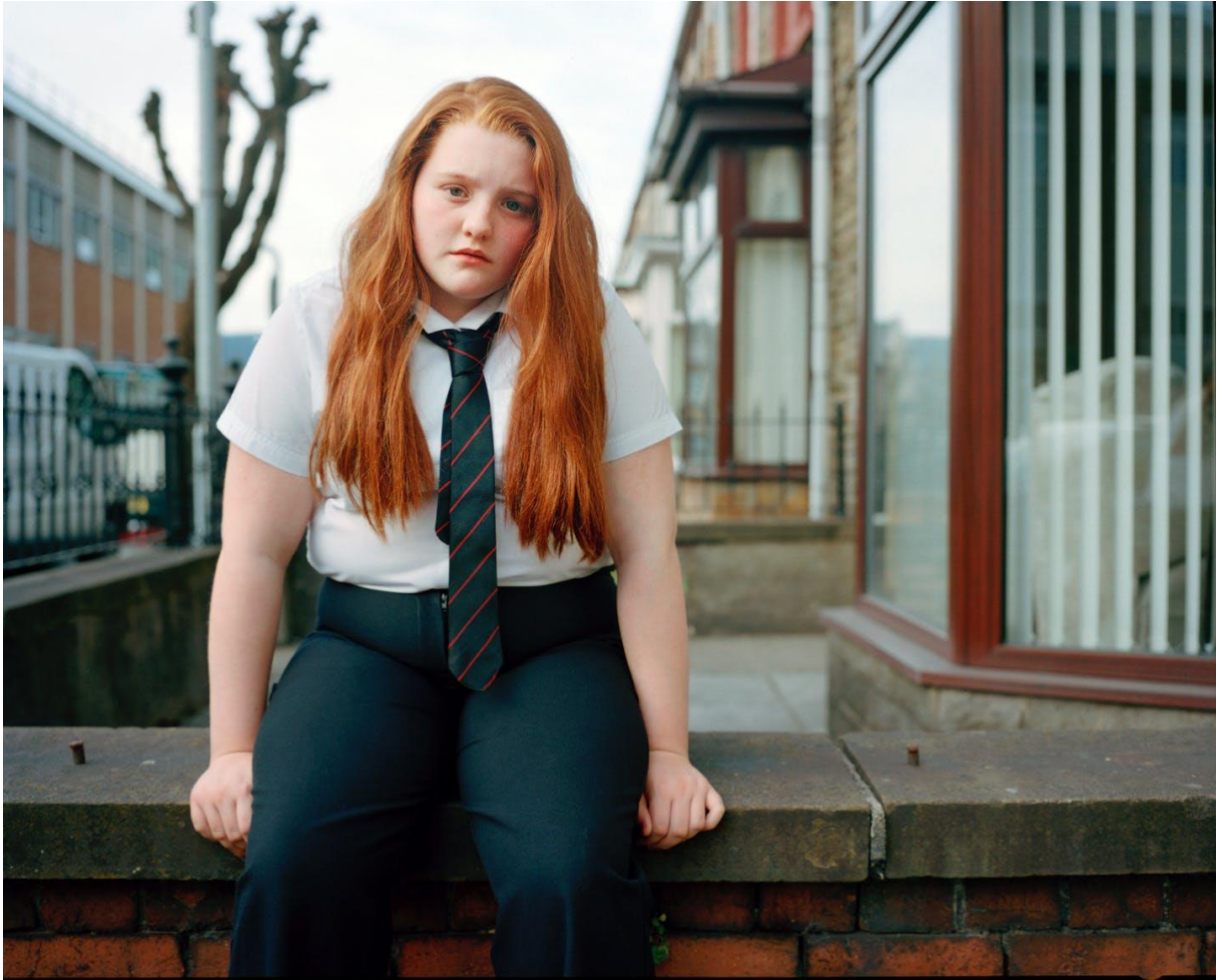
Bild 11. Tillgänglig: https://www.topic.com/the-true-weight-of-teenage-obesity