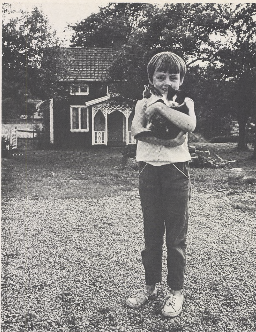
Vi väntar också på brevvärdarna

Med ledning av inkomna fakturaspecifikationer gjorde posten år 1975 en beräkning av i vilken omfattning kommunerna beställt tjänster i den sär-