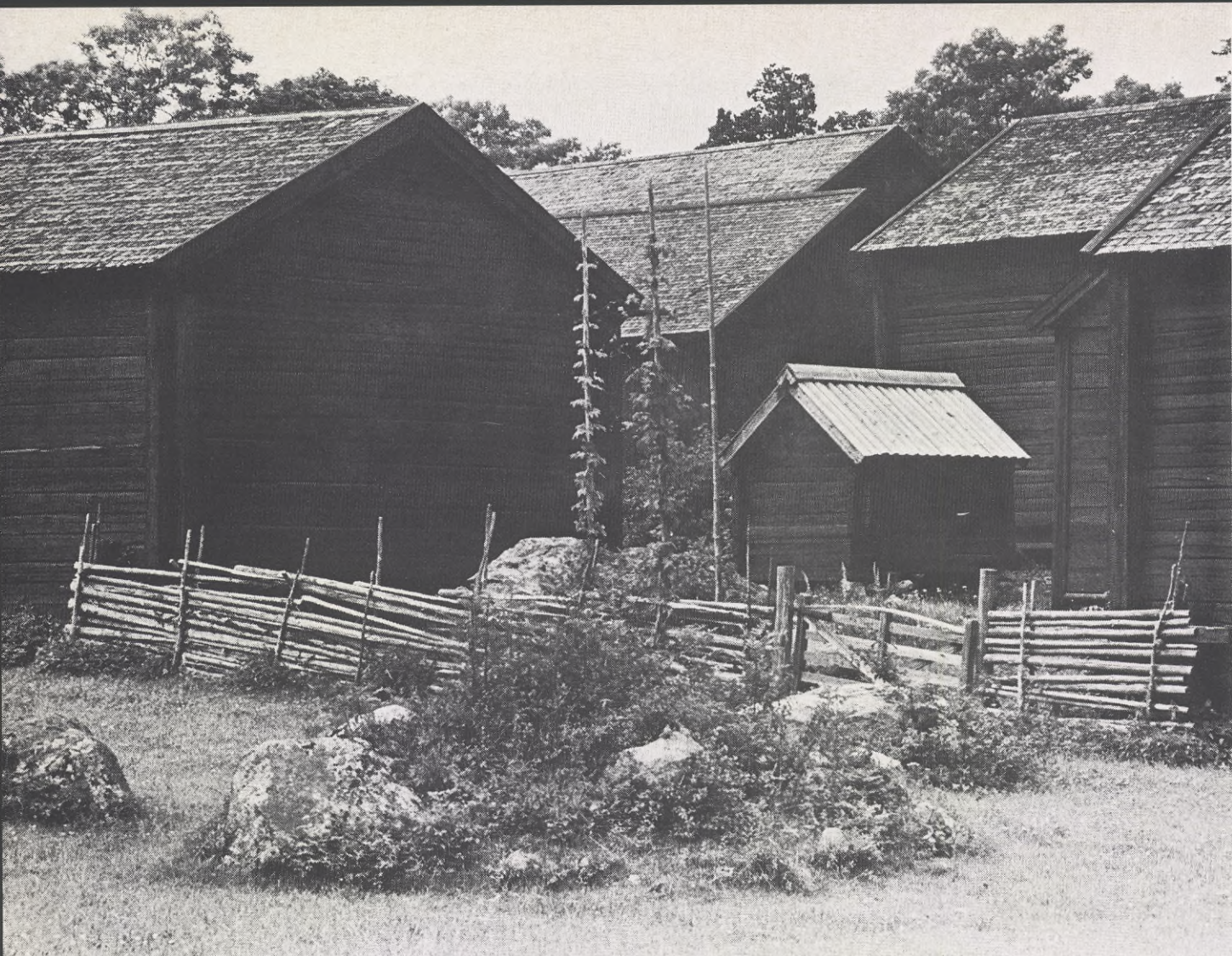
För invånarna på landsbygden kan kommunerna beställa tjänster av lantbrevbäraren