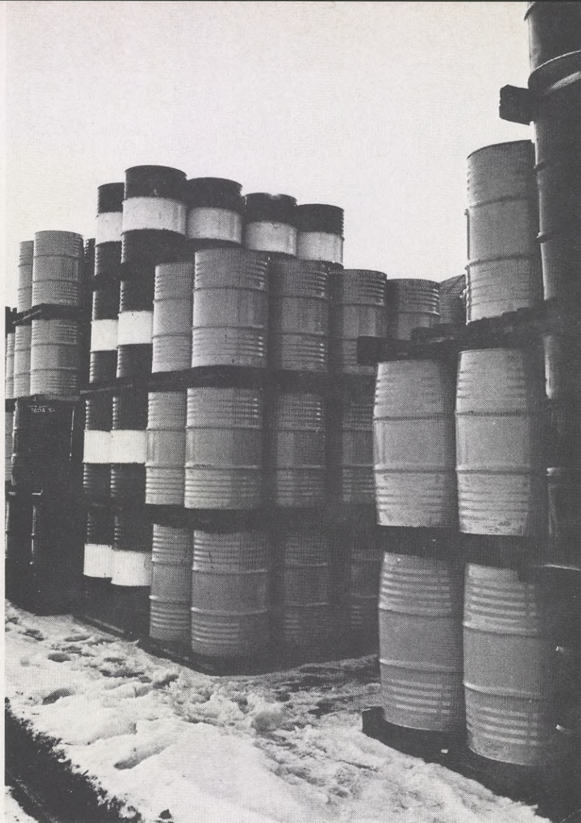
Det finns minst mellan 50 och 60 miljarder fat olja i Prudhoe Bay i Alaska

bergskedjan Brooks Mountain, kan man se nordsluttningen sänka sig ned från bergen omkring 250 km fram mot Ishavet. Detta flacka område, med tundra som är nästan helt utan markerade drag, utbreder sig från öster till väster omkring 1 600 kilometer.