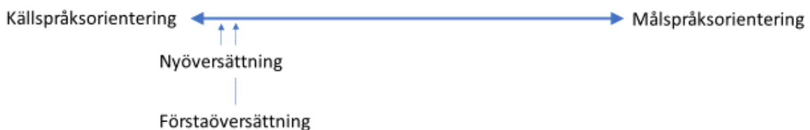
FIGUR 2. Positionering av förstaöversättningen respektive nyöversättningen på skalan mellan källspråksorientering och målspråksorientering.

Mot bakgrund av Tourys syn på källspråksorientering och målspråksorientering som två extrema punkter på en skala kan man säga att både förstaöversättningen och nyöversättningen är tydligt starkt källspråksorienterade vad gäller hantering av egennamn, men att nyöversättningen visar en aningen starkare källspråksorientering. Figur 2 nedan illustrerar hur detta kan representeras på denna skala: