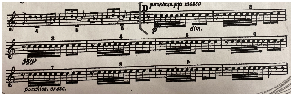
Exempel 1, N. Rimskil-Korsakov Shehearzade , virveltrumstämman bokstav D.

Det är inte förvånande att de tio takterna efter bokstaven D i tredje satsen från Rimskij- Korsakovs Scheherazade förekommer under slagverksprovspelningar. Den spelande måste hitta en lugn i sig själv och se bortom nervositeten för att kunna spela en svag och snabb rytmisk figur.