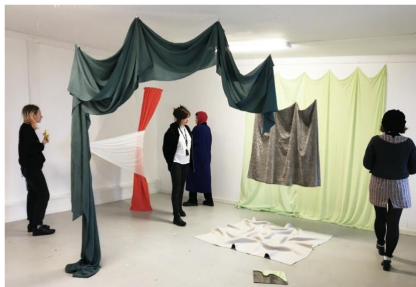
Dokumentation från tidigare arbete

Ridå, gardin, draperi har varit återkommande och något som vandrat bland olika rum i mina arbeten – från kojan till hemmet till scenen. Hösten 2019 fick en ridå, gardin, draperi-liknande form Porten som titel. I och med det har jag intresserat mig för rum som kretsar kring portar, kolonner och palats – där porten var grunden och kolonnen ett viktigt element som gav stöd till porten och sammanhanget. Porten var utan väggar, som en ingång i bilden och rummet eller ibland som en ram. Den har främst fått vara något som talar om en framsida, en form som visar riktningen i bilden. Ibland öppen att gå igenom eller slutet och tvingar betraktaren att gå runt.