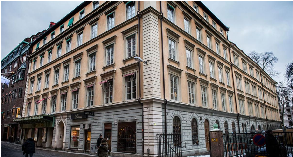
Fig 1. Foto av Astoriahuset innan rivning.