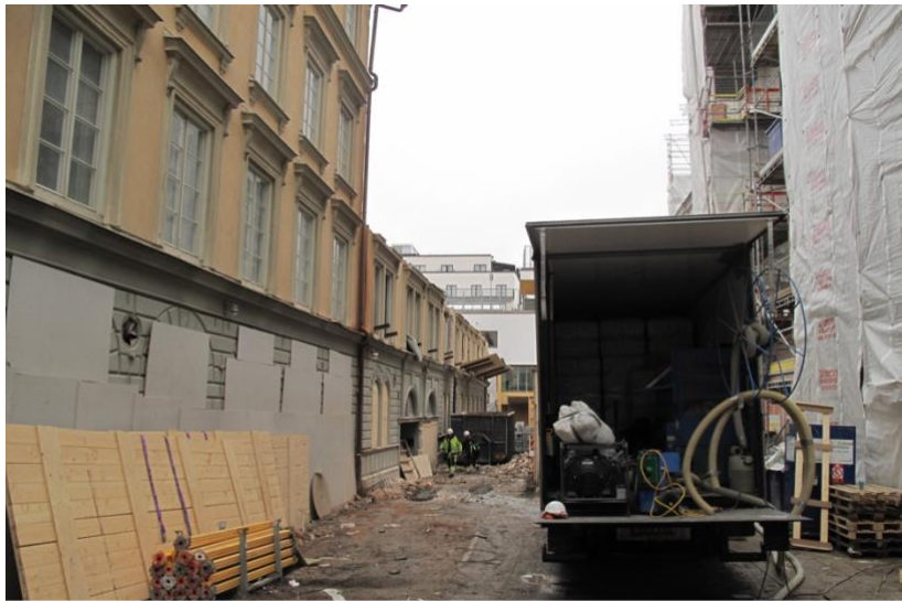
Fig 3. Foto från rivningen av Astoriahuset.

Rivningen påbörjades i januari 2018 (Anrell 2018). Två tredjedelar av kvarteret revs för att en ny större byggnad ska uppföras. Ingreppet innebar en påtaglig inverkan på den klassiska stenstaden som även ingår i Stockholms riksintresse. Astoriahuset var gulklassificerat av Stockholms Stadsmuseums kulturhistoriska klassificering, men enligt expertuttalande borde den ha haft en högre grönklassificering (Ingo, Berglund & Pemer 2018, ss. 13–14). I och med diskussionen om rivningen av huset har mycket kritik ställts till fastighetsägaren, Humlegården, och Länsförsäkringar som är ägare till fastighetsägaren (Wenander & Berglund 2016).