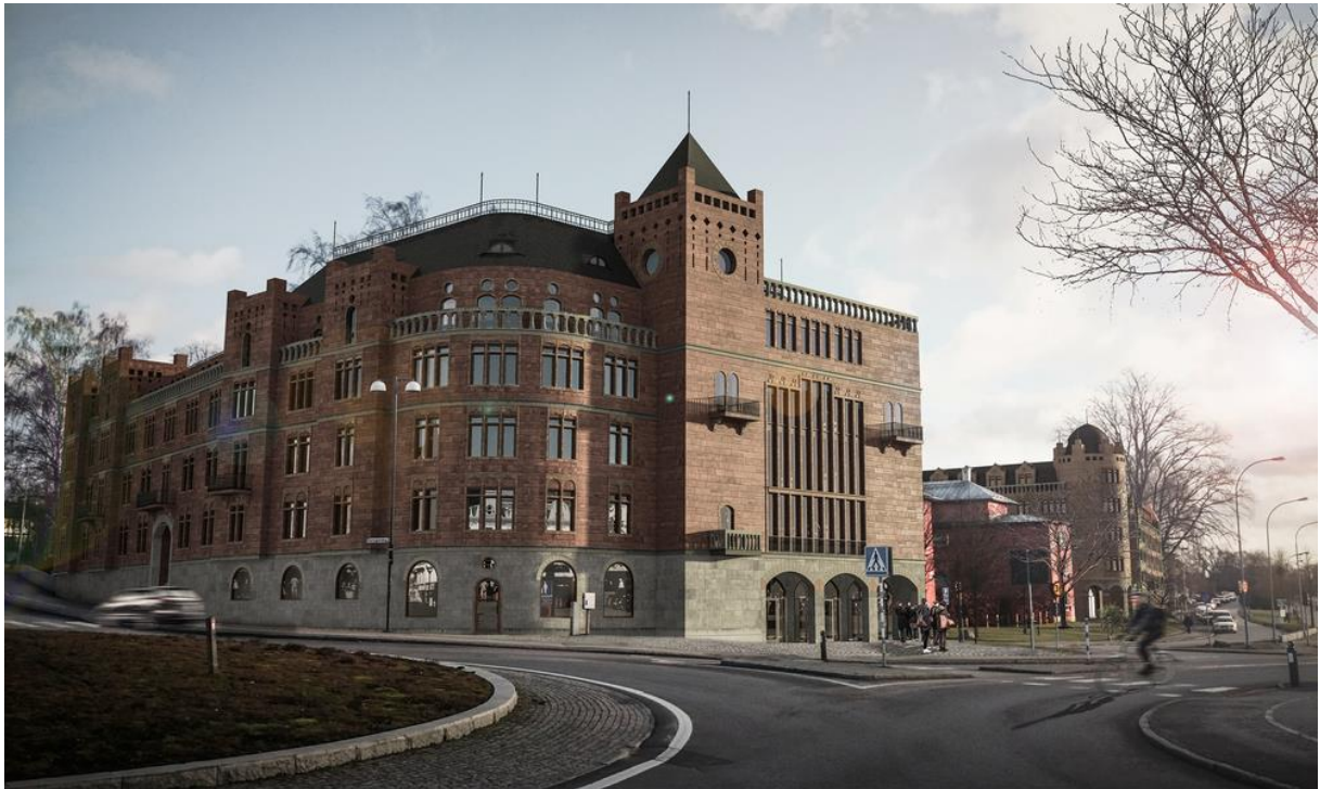
Figur 3: Illustration över en av byggnaderna som planeras uppföras.

Fasaden planeras att utföras i kalksten från Öland och Europa. 55 Det första som slår en då man ser bilden på byggnaden (se figur 3) är möjligtvis dess torn och rundade hörn. Den översta av de fem våningarna är indragen med en terrass som definieras genom en balustrad i ljusare ton än resten av byggnaden. Byggnadens fasad bryts av genom några mindre och ett större tornliknande element. Fasaden präglas av ett stort antal fönster och nedersta våningen markeras mot resten av fasaden då den är utförd i ljusare sten. Den sluttande tomten gör att våningen ligger i souterräng.