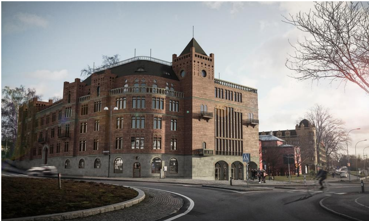
Figur 10: Det är möjligt att den bild som förekommer oftast i debattens texter inte ger ett klart intryck över byggnadernas storlek i förhållande till omgivningarna.

Det är en bred variation av människor som ger sig in i debatten för att försvara bygget, de är ofta inga experter på arkitektur men har väldigt starka åsikter ändå. Jag menar ändå att det finns en viss generaliserbarhet över att likställa dessa människor med ”allmänheten” då tidigare forskning visar att människor ofta gillar ny arkitektur med starka historiska referenser. 103 Dock visar Catharina Sternudds avhandling Bilder av småstaden – om estetisk värdering av en stadstyp att lekmän också generellt uppskattar ”småskalighet” i arkitektur. 104 Det är då spännande att debattörerna som är för bygget inte verkar störas av byggnadens storlek.