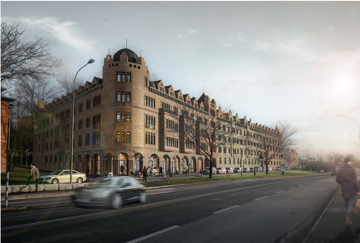
Figur 5: Illustration över en av byggnaderna som planeras uppföras.

Byggmästaren är utformad i en sammanhållen kvartersform där det bildas en innergård. Likt Sigfridshäll planeras fasaderna att utföras i kalksten från Öland och Europa. 56 Nordvästra hörnet är markerat i form av ett avrundat torn. Takvåningen är även på denna våning inskjuten med en terrass och består långa rader med takkupor. Nedersta våningen består bland annat av en arkad och enligt Spridds hemsida finns därbakom butiker och kaféer, samt en portik till innergården. Fasaden mot Inglestadsvägen består i tre olika delar som alla har variationer på samma motiv. Till exempel fönsterindelning, valvformer och takkupor. 57