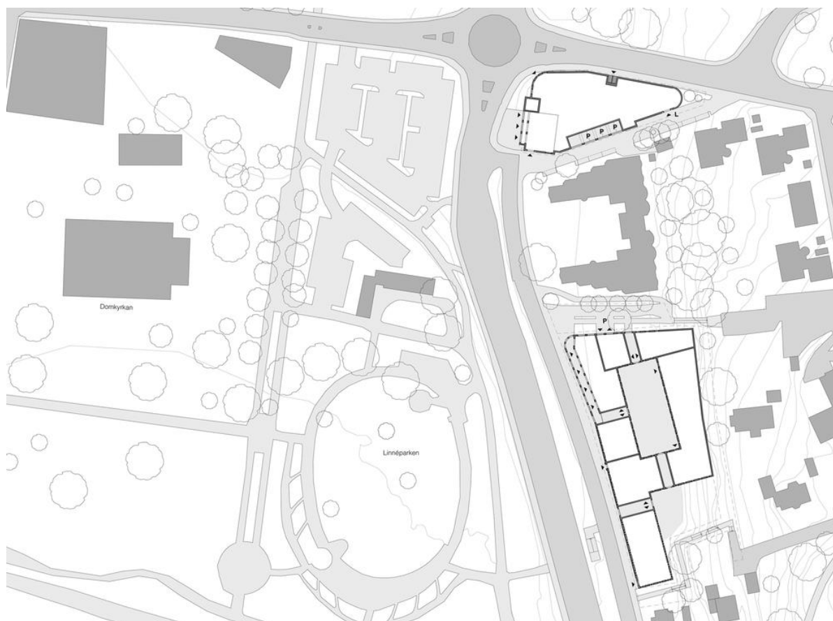
Figur 2: Situationsplan som visar de två byggnadernas placering i förhållande till närmsta omgivningen.

Projektet består av två delar som berör olika fastigheter, kv Växjö 11:5 (Sigfridshäll), som på situationsplanen är den översta av de två byggnaderna samt Byggmästaren 14, 17 och 18 (kv Byggmästaren) som syns nederst. Sigfridshäll är omkring 7000 kvm och kommer innehålla kontor och restaurang. Byggmästaren är på omkring 14 000 kvm och kommer innehålla bostäder, butiker och kontor. Parkeringar i anslutning till byggnaderna ska tillkomma i form av parkeringshus med två plan under hela kvarteret. 54