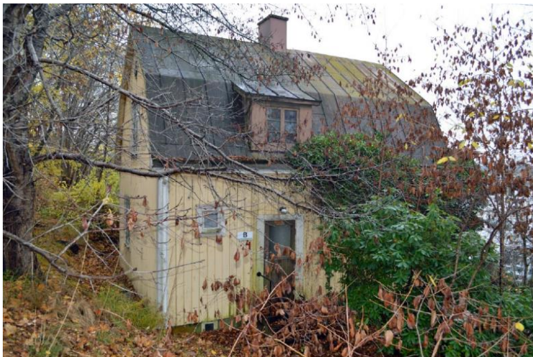
Figur 7: Bilden visar huset på byggmästaren 18, en solitär som påvisar den äldre bebyggelsestrukturen i området. Bilden är tagen ur Palmblads kulturhistoriska utredning från 2015.

I en kulturhistorisk utredning kommer antikvarien Samuel Palmblad vid Smålands museum fram till att de flesta av byggnaderna på de berörda fastigheterna inte har kulturhistoriskt värde av den dignitet att de måste bevaras. Dock menar han att byggnaden på fastigheten Byggmästaren 18 innebär ett dilemma. Byggnaden kommer att rivras om projektet genomförs. Byggnaden som uppfördes 1932 utstrålar trots dåtidens funkisgenombrott tidstypiska drag för 1920-talet. Landstinget som övertog fastigheten 1976 begärde rivning år 2009 men nekades bland annat på grund av att Smålands museum yttrat att byggnaden är kulturhistoriskt värdefull. 60 Området kring Byggmästaren 18 har under efterkrigstiden utsatts för kraftiga förändringar och otaliga byggnadsverk har rivits, däribland Östergårds herrgård. 61 Byggnaden är nu en solitär som påvisar hur den äldre herrgårdsmiljön såg ut. Byggnaden är idag förfallen och tomten är igenvuxen. Därmed är den också mycket undanskymd från gatuvyerna. Smålands museum kommer inte att driva någon bevarandefråga kring byggnaden. 62