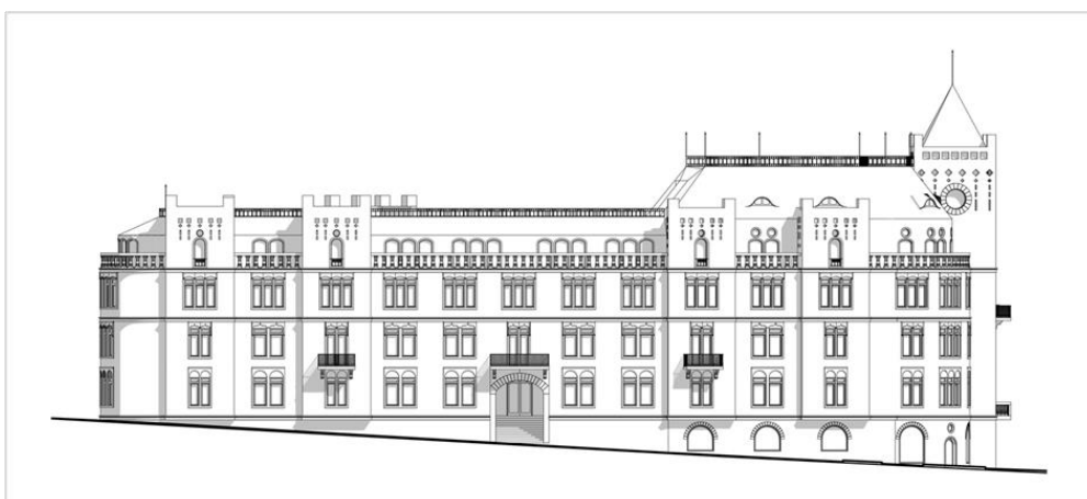
Figur 4: Fasaddrättning över en av de planerade byggnaderna.