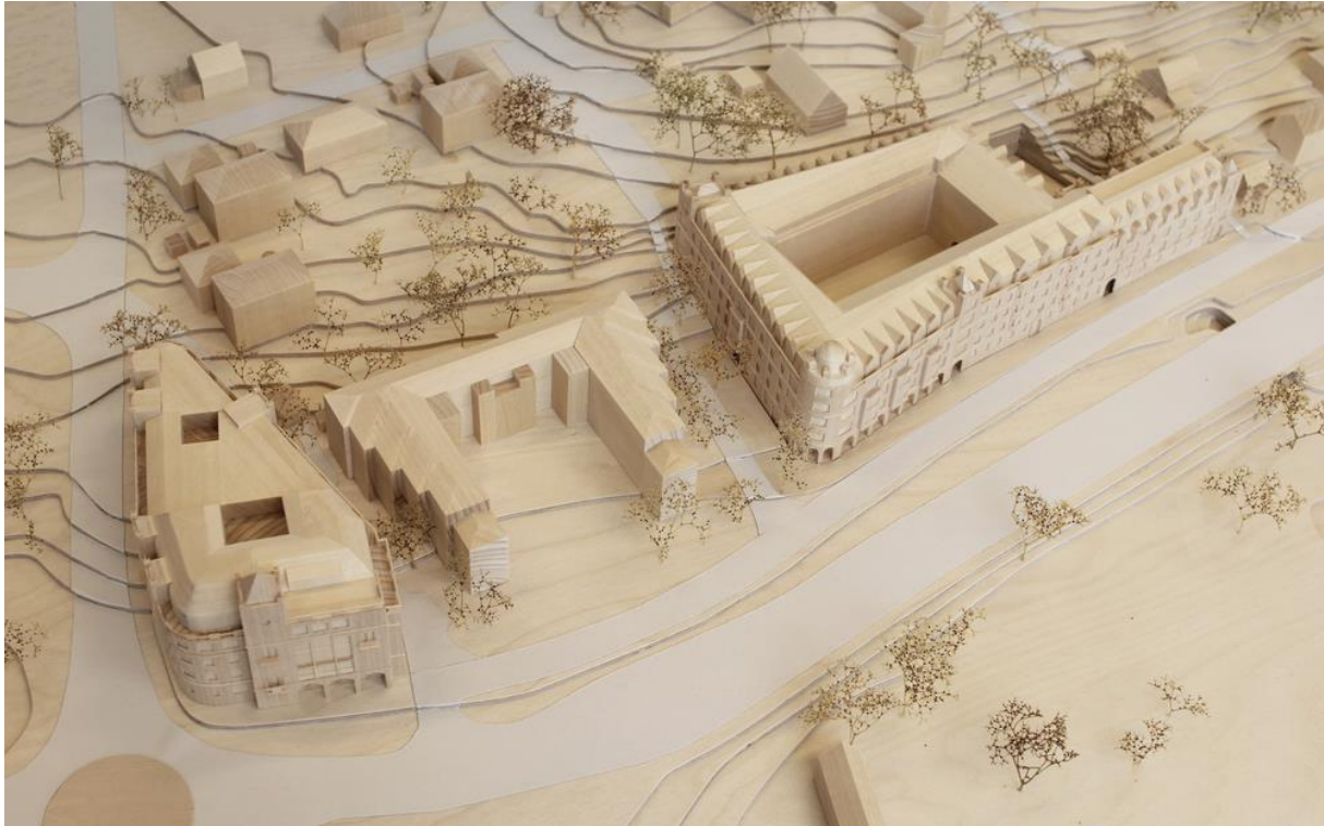
Figur 9: Arkitekterna menar att det syns tydligt i modellen som finns på kommunen att byggnaderna inte är väl anpassade efter omgivningarna.

Det är tydligt vilka aspekter av byggnaden som främst kritiseras i brevet. Höjd, volym, skala, utbredning, rubbade siktlinjer och anpassningen till stadsdelen. Det är inte själva konceptet av ny arkitektur med kraftiga referenser till äldre arkitektur som kritiseras. Detta kan vara på grund av vilka argument arkitekterna faktiskt tror skulle kunna få byggnadsnämnden att tänka om. Olika syn på vad som är fint och fult är en sak, men om byggnaderna riskerar att förvanska riksintresset är en annan. Det är en väldigt hög grad av affinitet som präglar texten. Det som sägs framställs som en sorts oomtvistlig sanning. Sista meningen är inte direkt en tillåtelse som de ger, men det drar åt det hållet: om byggnadsnämnden följer det som sagts så kan platsen tillföra något till resten av miljön. Arkitekterna nämner aldrig byggnadernas arkitekt eller beställaren till projektet utan byggnadsnämnden är den enda som ges någon sorts agens i situationen.