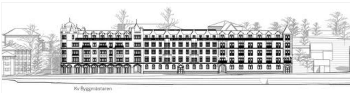
Figur 6: Fasadrättning över en av de planerade byggnaderna.