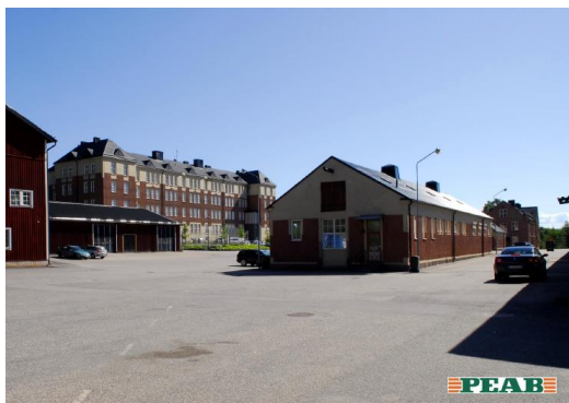
Figur 9: Befintliga bebyggelse på Regementsområdet i nära anslutning till det tilltänkta torget.