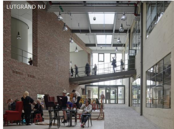
Figur 5: Del av Simonsland interiört efter genomförande av detaljplanen.