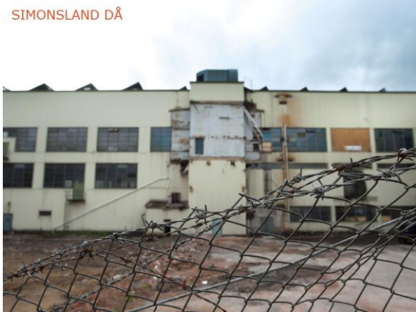
Figur 3: Del av fasad på området Simonsland innan genomförande av den nya detaljplanen.