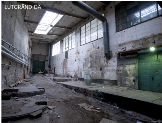
Figur 4: Del av Simonsland interiört innan genomförande av detaljplanen.