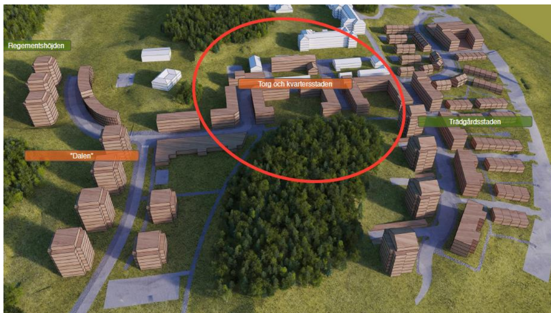
Figur 7: Bild som visar placering av ny bebyggelse i förhållande till den befintliga som på bilden utgörs av de vita byggnaderna. Detaljplaneområdet som är objekt för fallstudien ligger inom rödmarkeringen.

I den här planen är det tydligt att ett av syftena är att bevara kulturmiljön men även att anpassa ny bebyggelse till den befintliga bebyggelsen. Detaljplaneområdet omfattar den lägre bebyggelsen som tids- och stilmässigt hör samman med Kaserngården. I planbeskrivningen finns ett avsnitt som behandlar hur ny bebyggelse bör utformas. Denna ska planeras i kvartersstruktur som fasthåller den tidigare nämnda mönsterplanen från de äldre regementsbyggnaderna. Den tilltänkta bebyggelsen planeras uppföras bland de bevarandevärda byggnaderna runt Mannerfelts plats. Nya byggnader ska uppföras i rutnätstruktur och så att ett offentligt torg skapas mellan dessa. För att säkerställa att ny bebyggelse utformas med hänsyn till den befintliga kulturmiljön så har byggrätterna som har ritats ut på plankartan blivit tilldelade hänsyn- och utformningsbestämmelser. I ett avsnitt som behandlar stadsbild och gestaltning står det följande om den tilltänkta bebyggelsen: