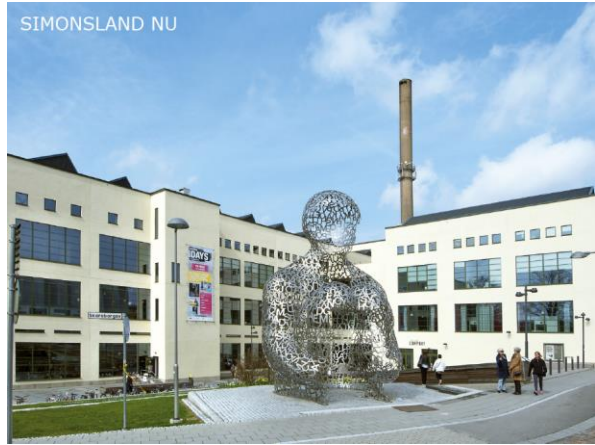
Figur 2: Huvudentré till textilhögskola och museum, området Simonsland efter genomförande av detaljplanen.