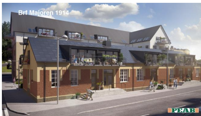
Figur 8: Visualisering av bebyggelse efter genomförande av detaljplanen. I förgrunden befintlig byggnad. I bakgrunden tilltänkt bostadshus.