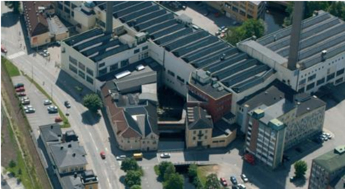
Figur 1: Området Simonsland sett från luften innan genomförande av den nya detaljplanen.

Området Simonsland ligger centralt i Borås nära stadens högskola. Ån Viskan rinner genom området som var en av de första platserna i staden för etablering av industriverksamhet under 1800-talet andra hälft. Industriverksamheten innefattade till en början ett garveri och ett bomullstryckeri. Under de första femtio åren skedde en kraftig förtätning av området och år 1918 etablerade sig AB Svenskt Konstsilke sin verksamhet i på platsen. Simonsland expanderade kraftigt på 1940-talet och industriområdet fortsatte växa både längs och över Viskan. Expansionen stannade av på 1960-talet men förändringarna fortsatte inom de befintliga byggnaderna (Borås stad, 2007. s, 4). Industriområdet Simonsland har kännetecknats av ständiga förändringar, både av verksamheter och genom till- och ombyggnationer av byggnaderna.