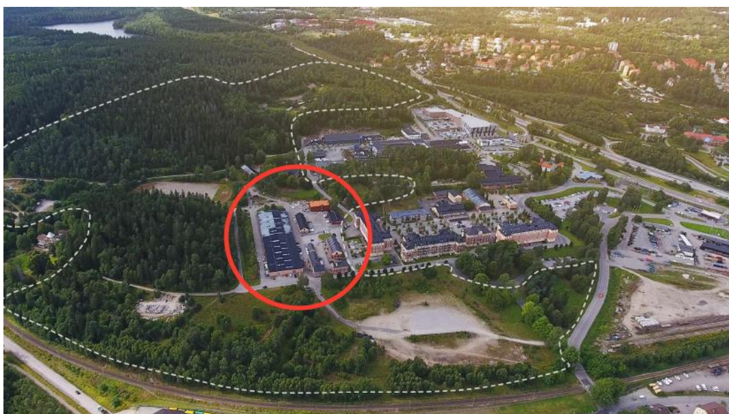
Figur 6: Regementsområdet som ska bli en ny stadsdel. Den delen av området som omfattas av den nya detaljplanen och etapp 1 i projektet ligger innanför rödmarkeringen på bilden.

Idag är kasernbyggnaderna ombyggda till bland annat bostäder, skola och verksamhetslokaler (Informant 5).