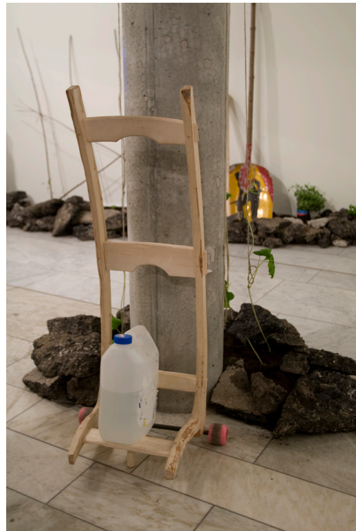
Fig. 3 Transportkärra av rotben och skateboardhjul. Lava Kulturhuset, Stockholm 2008