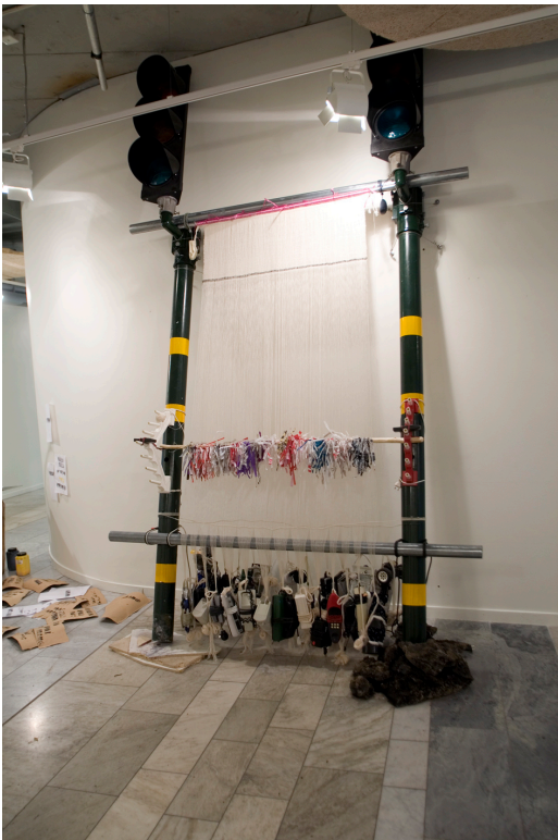
Fig. 2 Varptyngd vävstol av trafikstolpar och telefonlurar Lava Kulturhuset, Stockholm 2008