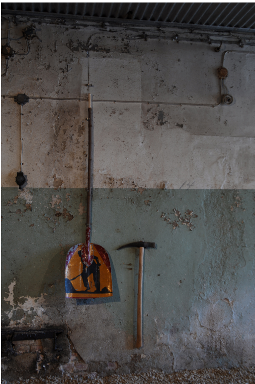
Fig. 4 Skyffel av vägs skylt och trähandtag samt smidd asfaltsbrytare Not Quite, Fengersfors 2009