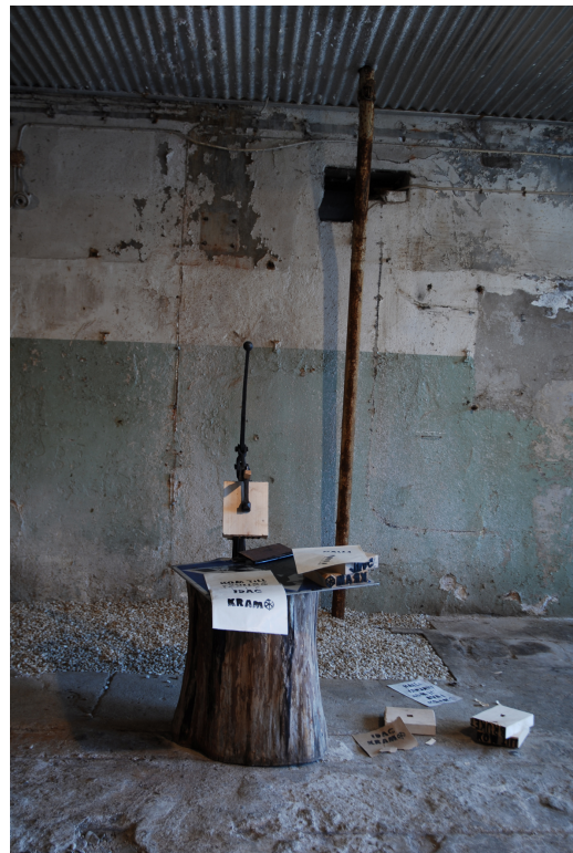
Fig. 5 SMS-press för tryck med träblock Not Quite, Fengersfors 2009