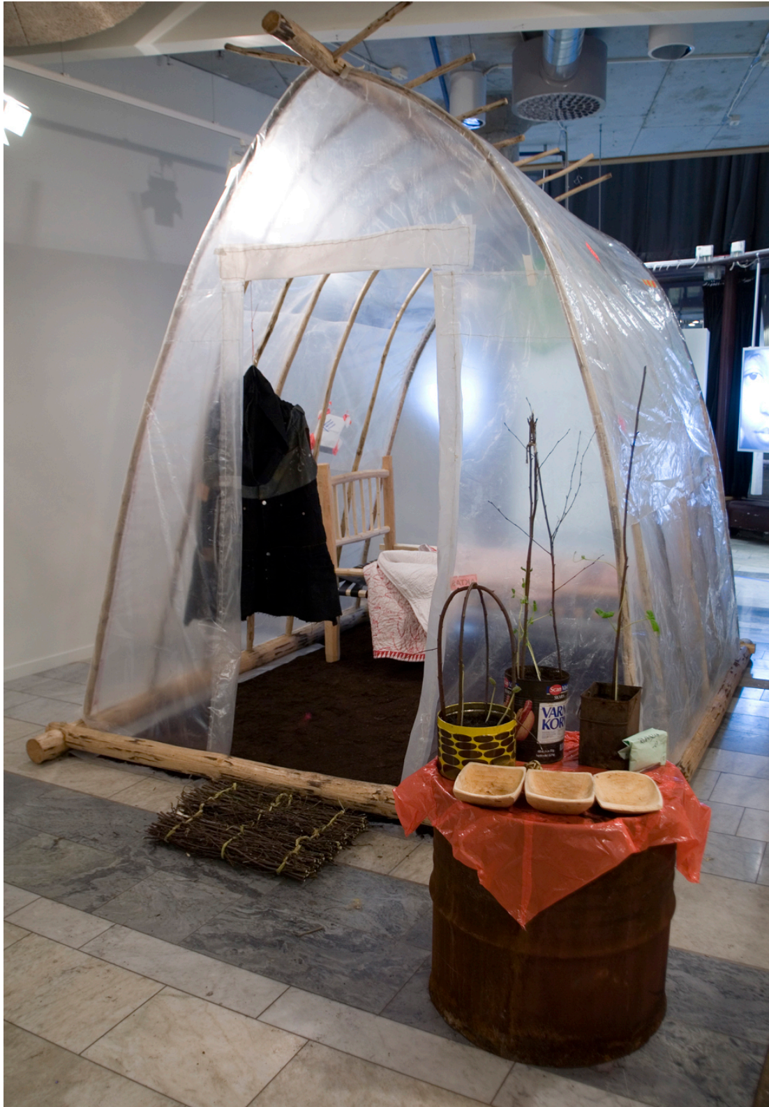
Fig.1 Hus av trä och byggplast med jordgolv. Inne i huset finns en säng av trä och säkerhetsbälten, ett broderat täcke och en sydd och broderad jeansjacka. Vid ingången till huset ligger en vävd dörrmatta av björkris. På en oljetunna står huggna trätråg och odlingskärl av plåtburkar. Lava, Kulturhuset i Stockholm 2008