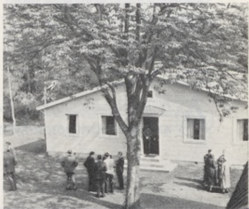
I det här huset sover kolonibarnen.

Efter några timmar var man åter i Malmö och nu vidtog en timmes förhandlingar. Här efter bjöd Malmö stad på middag för hela kongressen. Samkvämet där-