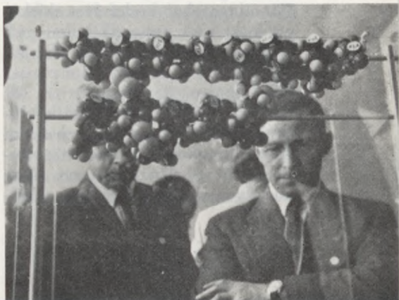
Två deltagare framför en modell av en insulinmolekyl hos Nordisk Insulinlaboratorium.

daterar sig från 1600-talet och är ofta omtalad i den danska skönlitteraturen. Den romantiska parken och den vackra egendomen skapar en atmosfär, som man nog inte kan finna någon annan stans. Numera ägs den av den mer än 600 år gamla kungliga skytteföreningen. Detta var verkligen en värdig avslutning på en framgångsrik kongress och vi tänker med tacksamhet på våra vänliga danska värdar, som visat så stort tillmötesgående.