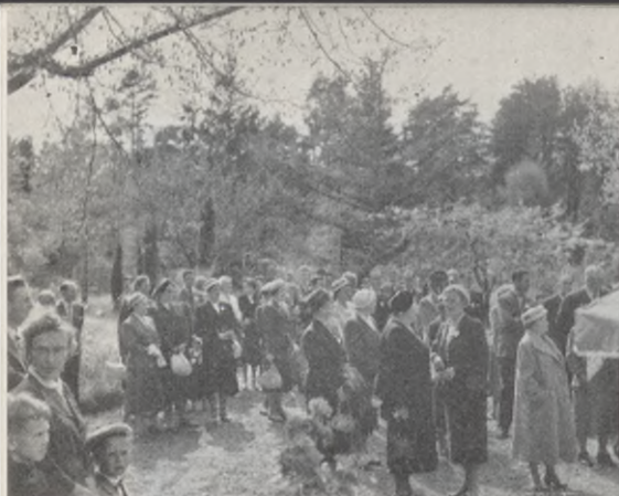
Några av kongressdeltagarna på utflykt.