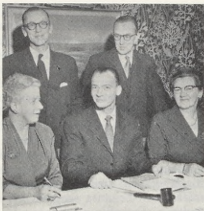
Några styrelseledamöter i Örebroföreningen