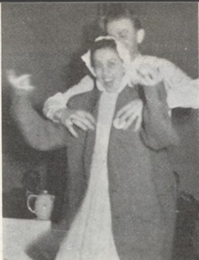
Damerna fick låna herrarnas kavajer när det var som roligast.

Besöket var naturligtvis mycket intressant. Det gav mängder av nyttiga lärdomar att föra vidare till föreningsmedlemmarna. Vad som emellertid utgjorde kongressens höjdpunkt var den lunch som Nordisk Insulinlaboratorium bjöd deltagarna på hos Den kongelige Skydebane Sølyst. Denna byggnad