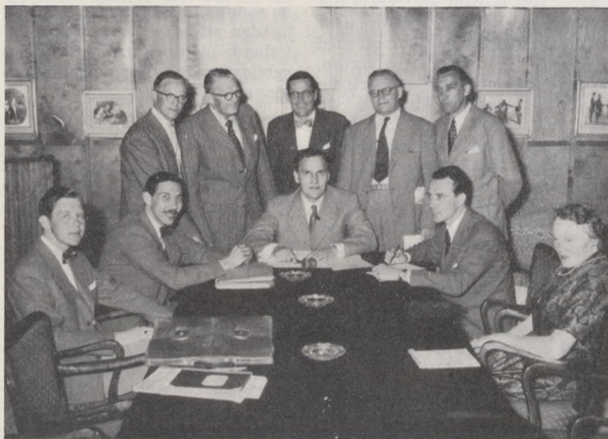
Förbundsstyrelsen vid sammanträde under riksstämman i Norrköping 1954