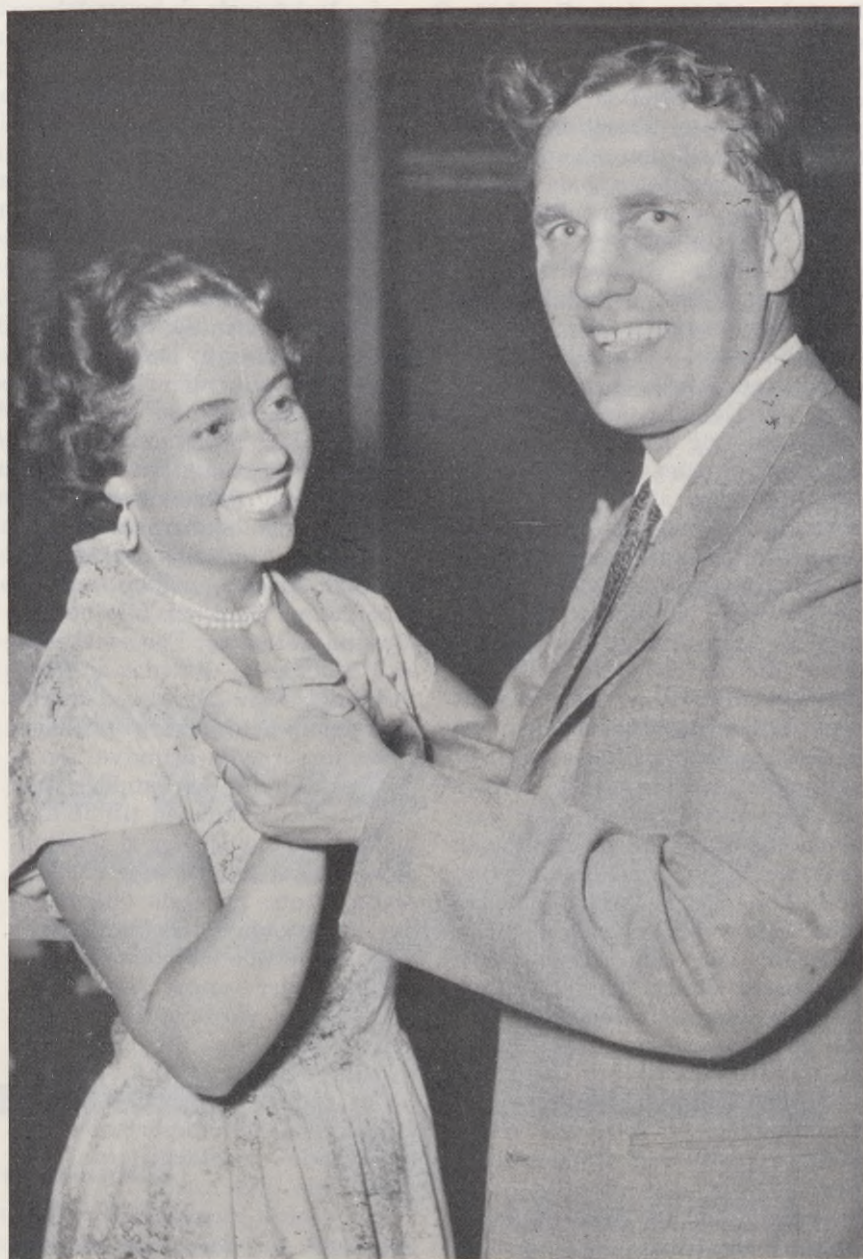
Från Riksstämman, Riksförbundets ordförande förlustar sig med Kiruna- representanter.