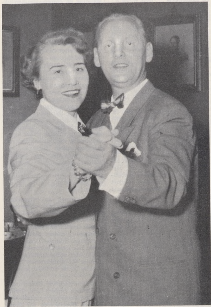
Från Riksstämman, Kristinehamn och Köpenhamn i ännu skönare blandning.