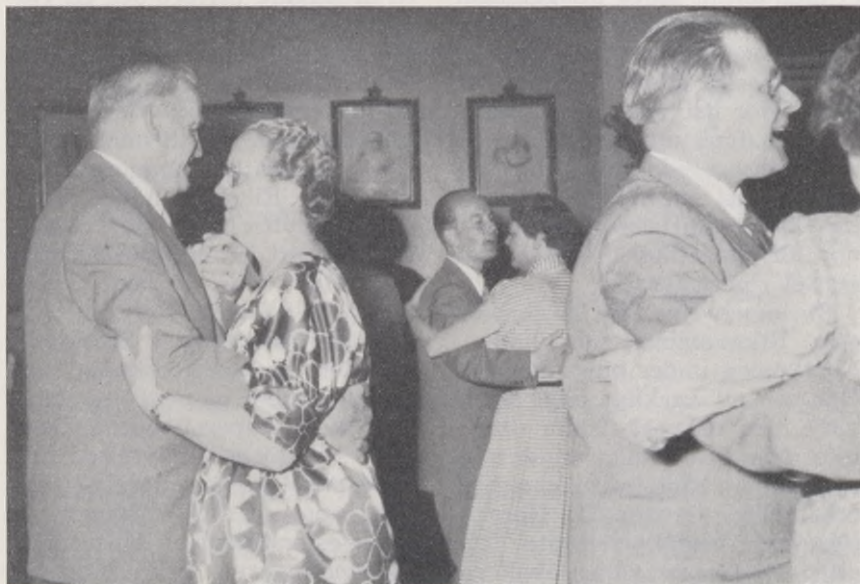
Från Riksstämman. Norrköpings Stadsfullmäktiges ordförande tar en svängom med sin fru.