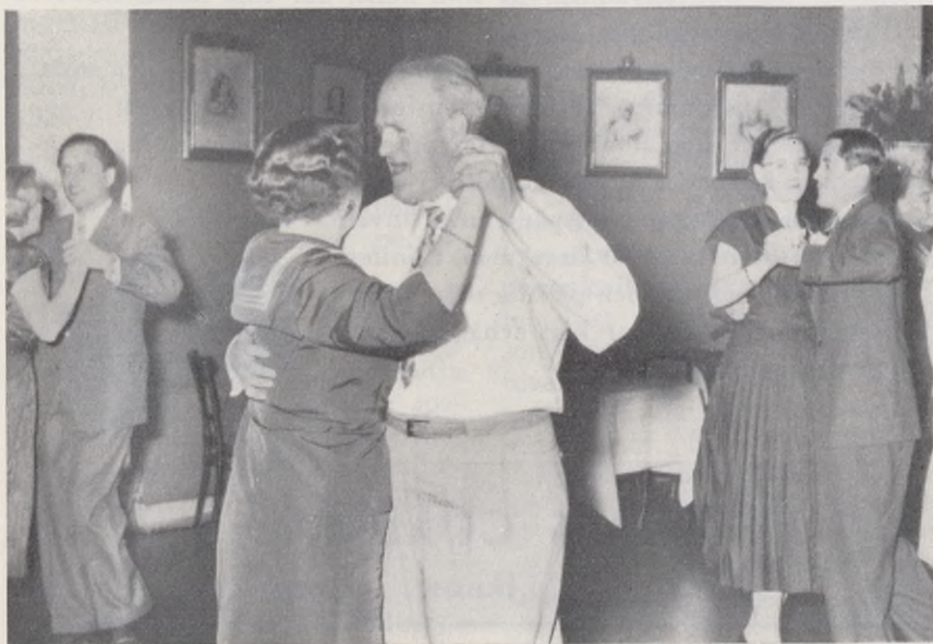
Från Riksstämman, Malmö, Göteborg och Stockholm i skön blandning.