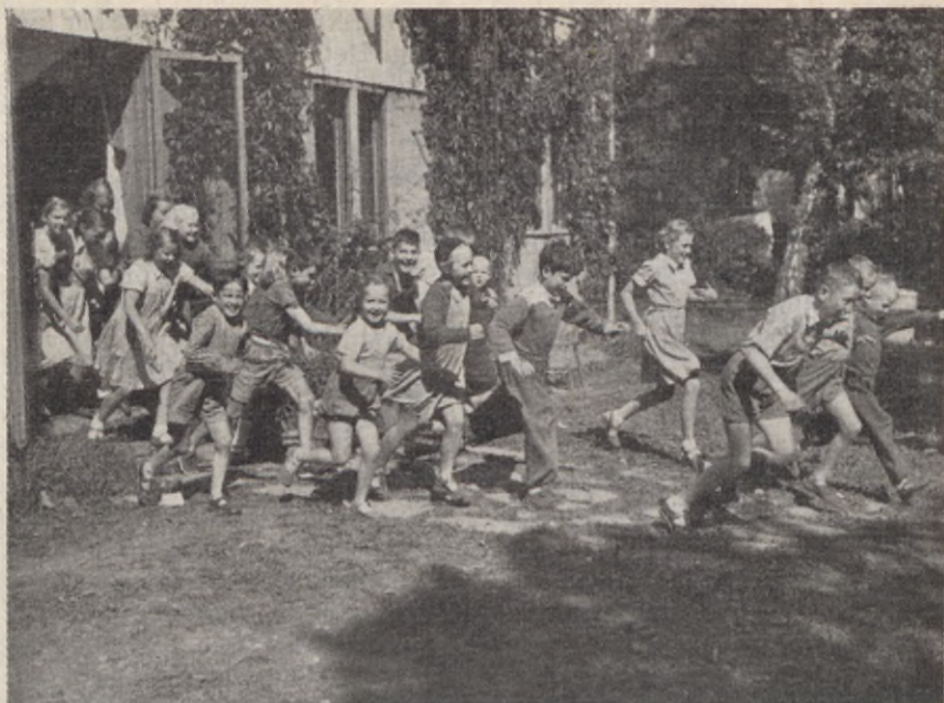
Så bra trivs dom

vanliga fall måste göra och de får därför avkoppling och vila på ett helt annat sätt än på en vanlig skollovskoloni.