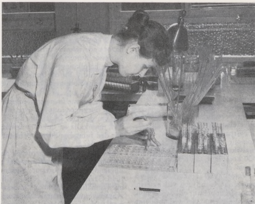
På Jungners laboratorium i Stockholm analyseras de prover som fältpatrullen tar

bristfrekvensen sjunkit bland de undersökta. Denna utveckling har delvis bidragit till att man numera endast behöver skicka cirka 10 procent av de undersökta till läkarmottagningen.