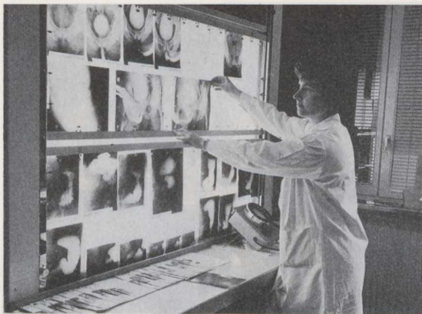
Röntgenavdelningen i ett läkarhus i Stockholm