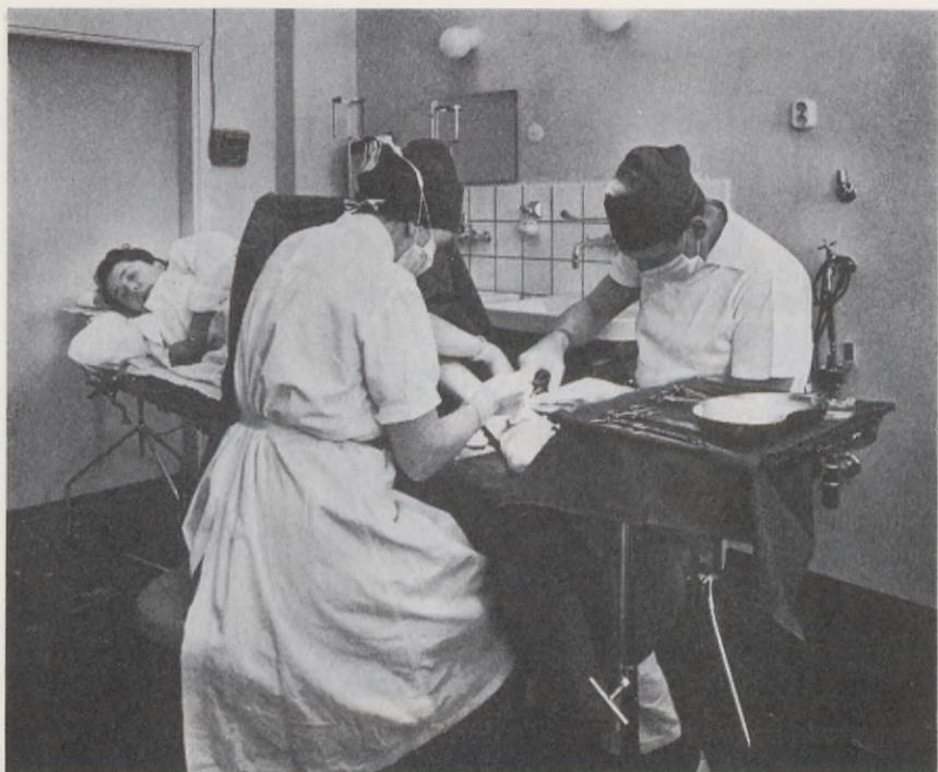
Operation i ett läkarhus

framtida utformningen av stadens öppna sjukvård, som framlades år 1958 av kommitterade för Stockholms stad och Sveriges Läkarförbund. De tidigare fem utgörs av gruppomtagningarna i Björkhamnen, Farsta, Gubbängen, Högdalen och Vällingby. Närmast i tur står Fruängen och Skärholmen.