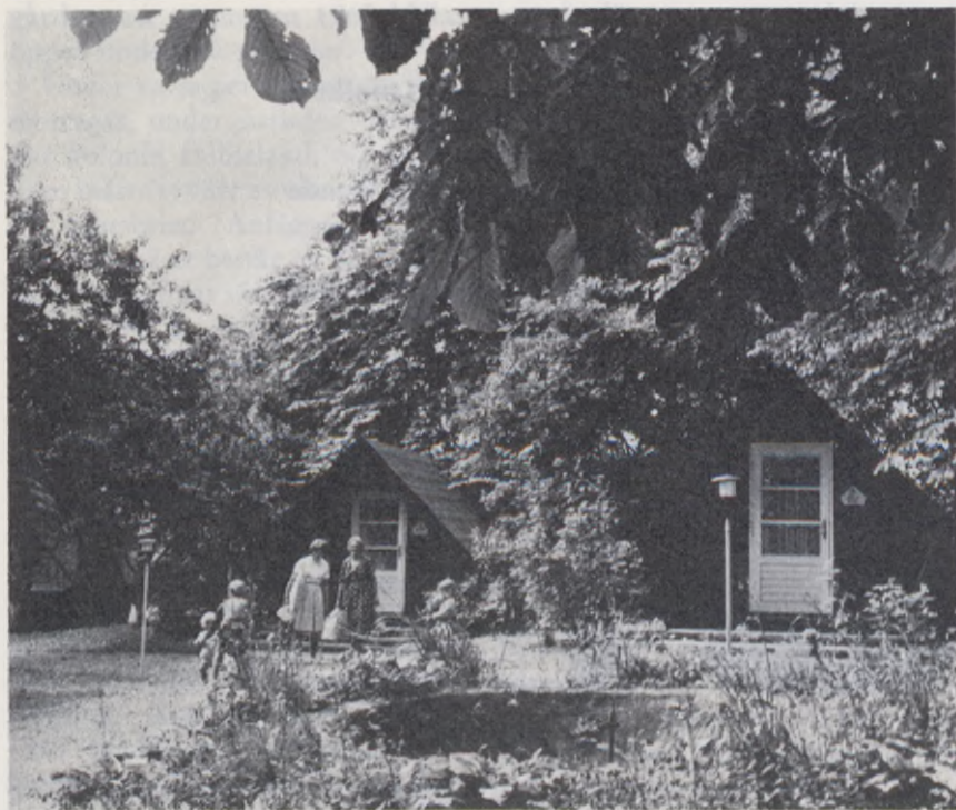
En semesteridyll i Danmark

Svenska Diabetesförbundet har tagit initiativ till skandinaviska utbytesresor för diabetiker mellan 15 och 20 år. Svenska diabetesungdomar kan få tillbringa sin semester i år i en dansk eller norsk diabetikers hem, under förutsättning att denne i sin tur får fira sin semester i svenskens hem.