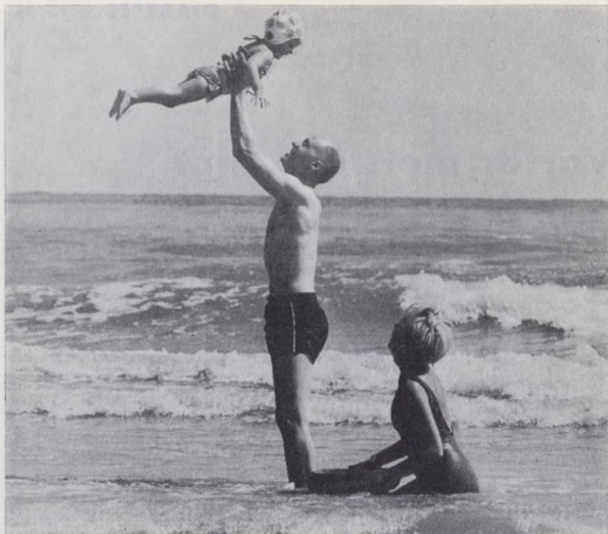
En glad familj på semester i Rimini