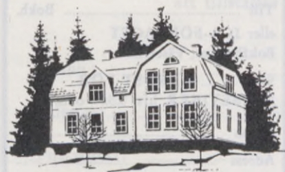
Diabetikergården i Nordanede

Som ett trevande försök kan man väl beteckna den familjevecka som var ordnad å Diabetesgården i Nordanede den 3—10 januari. Vi som hade nöjet att vara där var helt förtjusta i den förnämliga gården. Förnämlig kanske framför allt för ungdomen. Men även för dem som är något äldre och speciellt för familjer är en vistelse där — längre eller kortare — att rekommendera.