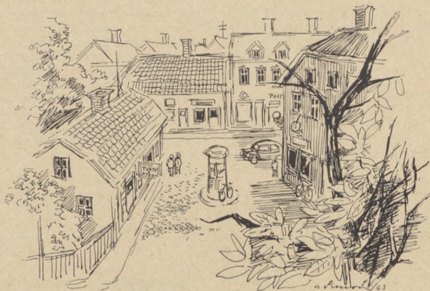
— Vem som helst såg att själva Förberga var "plus minus noll"...