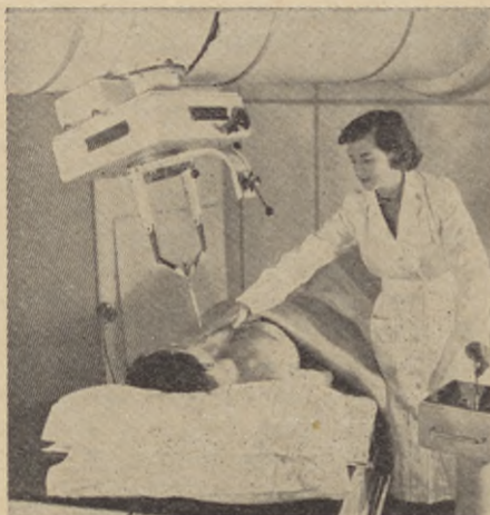
Medicinen använder röntgenstrålar inte bara för diagnos utan också för behandling av bl. a. tumörer.

alltjämt lika klart. De osynliga strålarna trängde genom papperet och påverkade den preparerade sidan.