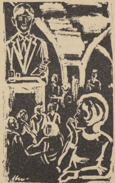
— Plötsligt tystnade de lågmälda rösterna, alla vände sig mot podiet, där kvällens gäst just tagit plats.

Och nu var hon här, på Diktarklubben, för att lyssna till skalden Hans Helmer. Plötsligt tystnade de lågmälda rösterna omkring henne, alla vände sig mot podiet, där kvällens gäst just tagit plats. Därhemma hade hon hans bild och urklipp av hans dikter uppsatta med häftstift ovanför sin säng. Men i verkligheten hade hon