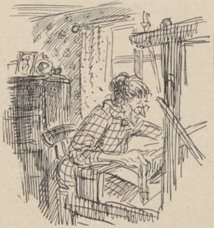
I stugorna dunkade vävstolarna på sommaren, man dunkade ihop stadiga tyger, slitvaror...

Kostymer som luktade illa och skor som klämde fick dock till sist ge vika för en större mänsklighet, för produkter utifrån, rymligare och vackrare höljen utan besvärande dofter och "inslag" på inhemsk natur. Köpvarorna trängde på. Vädstolen dunkade mera sällan. Den försvann väl inte helt, men dess avgörande betydelse flyttade åtskilliga trappsteg, ända upp på vinden under takåsen. Där fanns också en stor låda. I den lådan låg gamla,