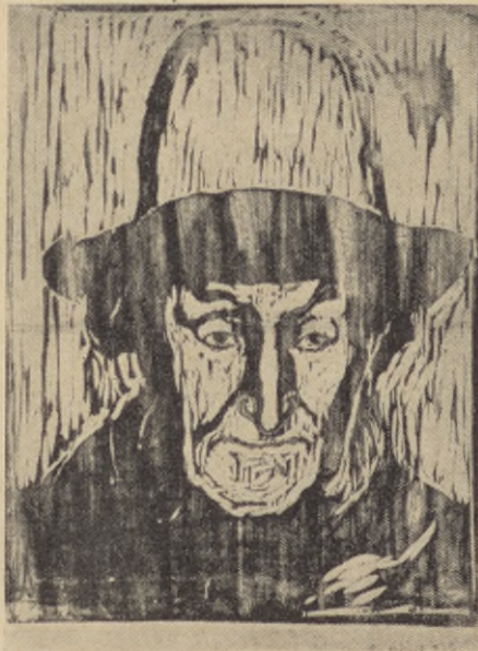
Den gamle skepparen, träsnitt 1899.

Strindberg, som Munch kom att sammanträffa med under åren i Berlin, och som i likhet med Munch kände sig missförstådd och förföljd, sade vid ett av de många angreppen mot konstnären: "Är det en nyhet för dig att stor konst brukar väcka förargelse."