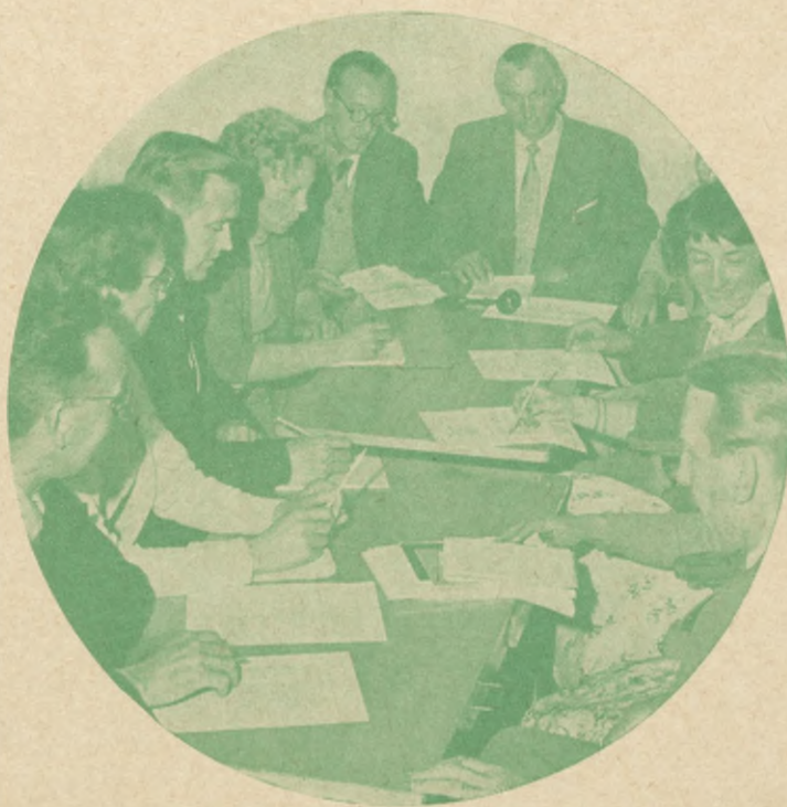
Arbetsgrupp vid en av riksförbundets socialvårdskurser