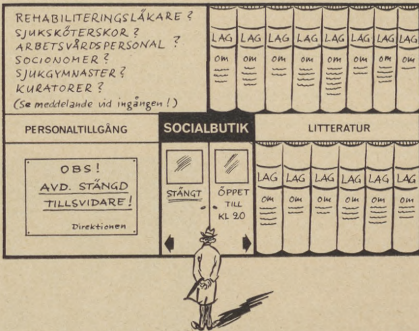
Att skaffa fram personalresurserna går inte lika kvickt som att stifta lagar. Det är en väldig skillnad mellan "tillgången" på tryckta lagar och betänkanden och "lagret" av personal, som ska föra ut det tryckta ordet i praktisk handling. När får vi "balans" mellan de båda avdelningarna i "socialsnabbköpet"?