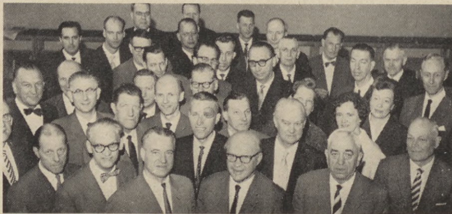
Representantskapet med experter och föredragshållare i Örebro.

Detta blir särskilt kännbart om man befinner sig i en låg sjukpenningklass.