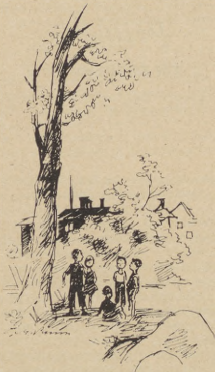
— Kliver nån över "Röda havet" så smälter det, sa han...

Det såg ju vem som helst att själva Förberga var plus minus noll — var Sybehör något, med sin reklamnål som en jättetand, samt med sitt ullgarnsnystan? Eller Tidningar & Cigarett med sin ask, sina bilder och nyheter, eller Tvätt & Stryk med skjortor i topp eller Posten med några sedlar, Läkar- och Tandläkarmottagningen med sin hotande tystnad, eller till exempel Järn & Färg med sin hammare i ena nypan och pensel i den andra? Eller Konditori Valfärden där de riktigt stora höll till?