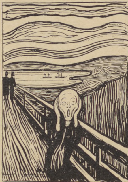
SKRIKET, litografi (1894-95).