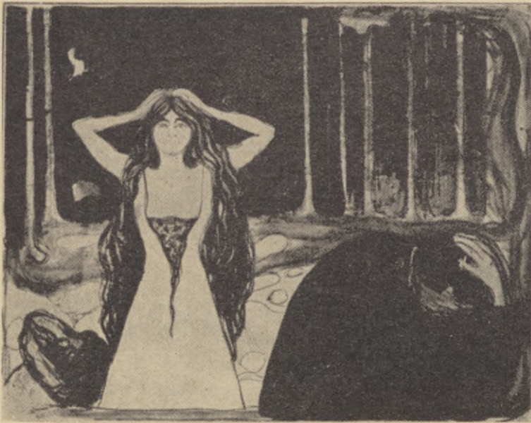
Månsken, litografi 1899.