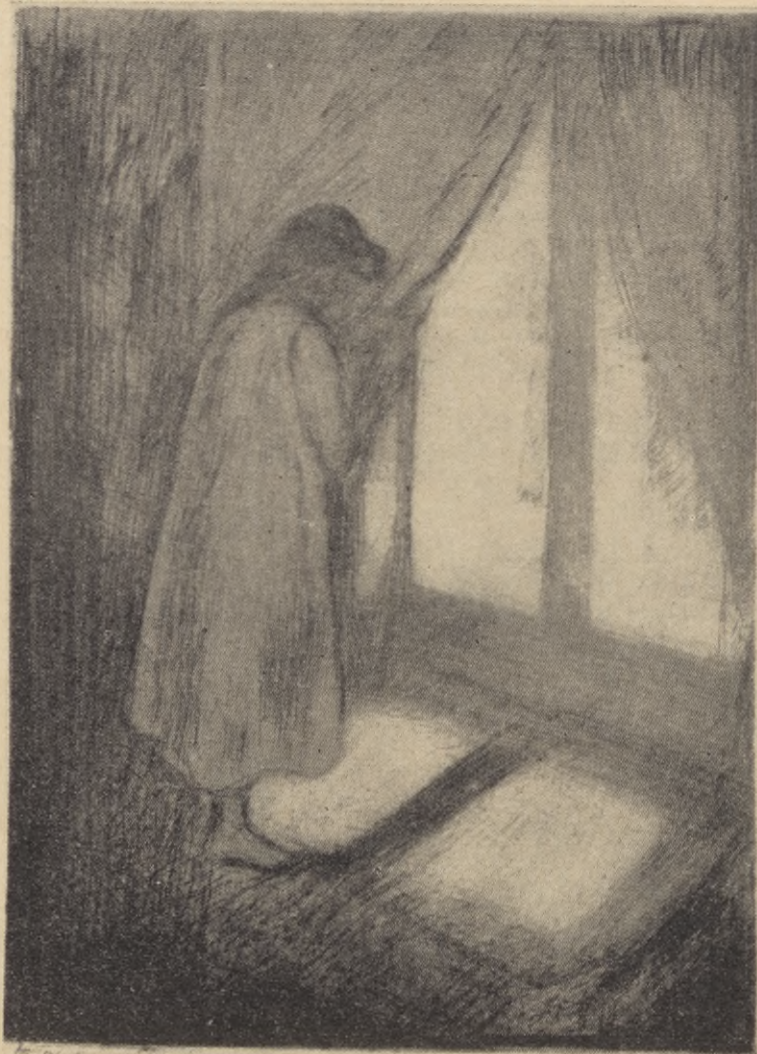
Flickan vid fönstret, radering 1894.

Det finns ingen utanför Frankrikes gränser som haft så stor betydelse som Munch för måleriets utveckling i vår tids konst. Men som många andra konstnärer i den moderna konstens genombrottsgeneration möttes han av ett våldsamt motstånd från kritiken. "Målaren Edvard Munch är bäst förtjänt med att man förbigår hans tavlor i tysthet", skrev bl. a. en känd konstkritiker om en utställning. I dag hör utställningens tavlor till det värdefullaste i Nationalgalleriet i Oslo.