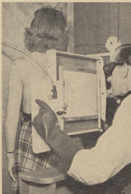
Nu kan vi bli "genomskådade" i en modern apparat med många nya finesser.

En översikt om röntgenstrålarnas historia av Arne Tallberg