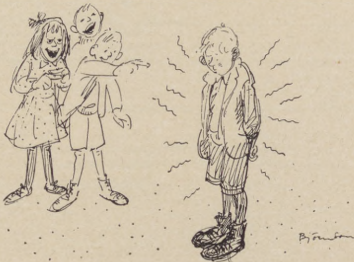
På rasten — efter det att Fröken anmärkt — kunde det strös ytterligare salt i såren: — "Hur många kosvansar har du i kostymer?"

kasserade skor med pinsamma veck och krökningar, smärtsamma ärr från barndomens steg, många mils tramp genom skolår, vintrar och somrar av skoskav, läxor, och tunga bärkorgar, lingon, hjortron och blåbär, tunga korgar, som bars över stock och sten i barndomens karga land. Skor som tryckte hårt och kläder med "inslag" av stall har här fått sitt sista vilorum, högst under takåsen. Och vår gamle, frälsige skomakare har för länge sedan dragit sin sista beckråd och slagit sin sista pligg. Hans yrke krympte ihop till ett minimum, bitterheten över gumiskornas frammarsch förbittrade hans sista levnadsår, men sin okänslighet mot skoskav behöll han även i motgångens tid.