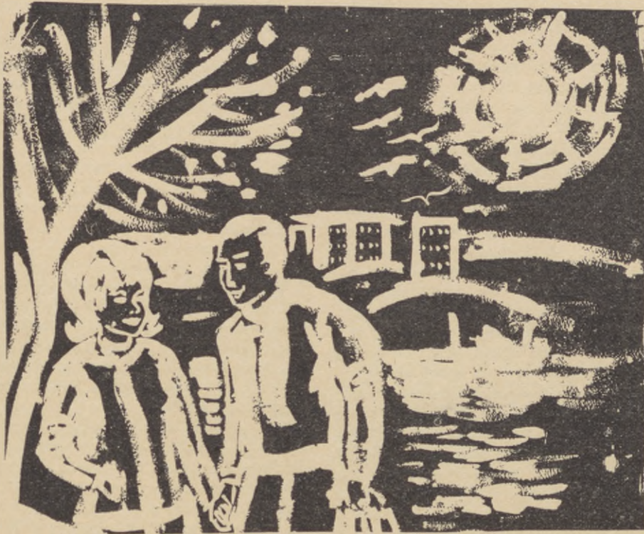
Teckningar: ELSIE BRITT STENQVIST