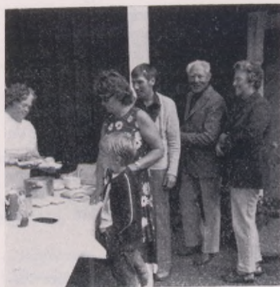
Varm korv bjöds det på i Finnsjöstrand.

Olika aktiviteter hade ordnats på Finnsjöstrand. De som inte hade tjuvstartat med kaffe vid gruvan fick tillfälle att inmundiga sitt medhavda kaffe dels inomhus men även utomhus i det vackra sensommarvädret. Många tog tillfället i akt till en båt- och fisketur på den vackra Finnsjön, som ligger som en trolsk mörk insjö inramad av mörka skogar och brant stupande klippor. Huruvida fiskelyckan