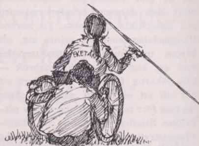
SPJUTKASTNING FRÅN RULLSTOL TILLHÖR DE SVÅRARE IDROTTPRESTATIONERNA.

På Tvååkers idrottsplats trängdes över hundra deltagare i handikapp-DM i friidrott. Det var fart, fläkt och glädje. Här kördes rullstol och kastades med spjut och slungboll, stöttes kula och löptes olika distanser, här möttes olika handikapp, hjärtsjuka, astmasjuka, rörelsehindrade, blinda och polioskadade. Här fanns tävlingsiver och festhumör.