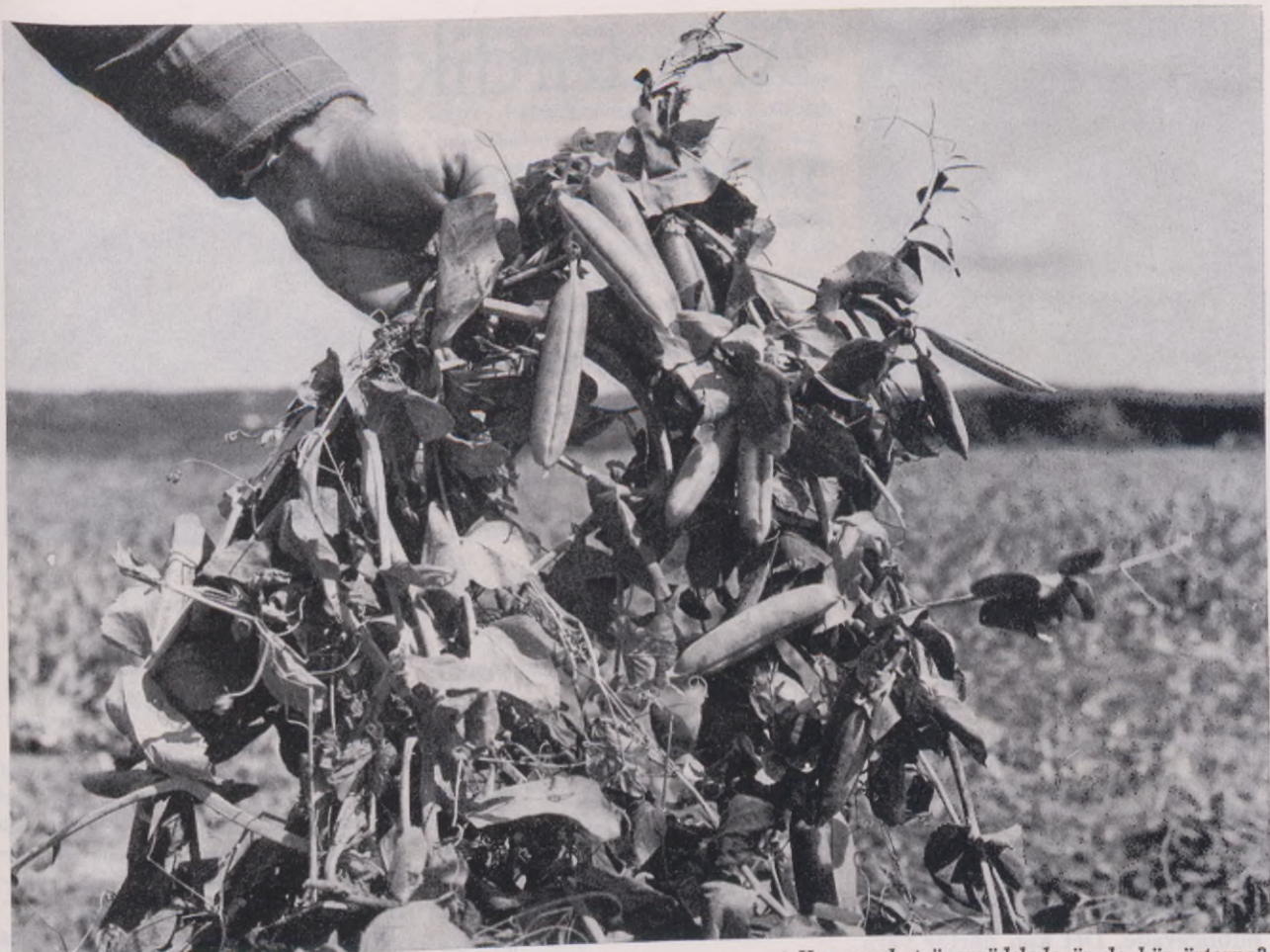
Hur mycket övergödslade är de här ärterna?

tankarna var att bisulfiten visat sig kunna framkalla ärftliga skador hos mikroorganismer (bakterier, jäst och virus).