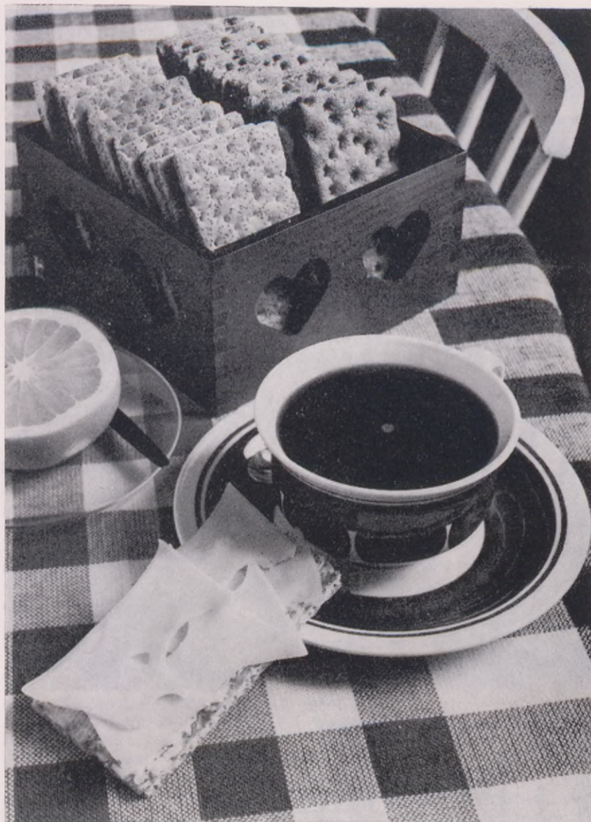
Även ost innehåller numera nitrit och antimögelmedel.

färg, dels påstås den ha en konserverande effekt.