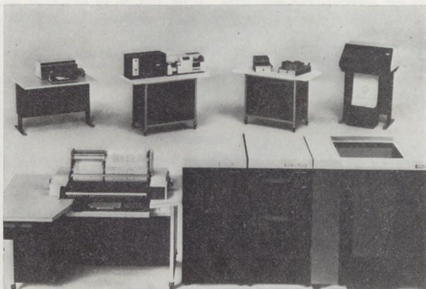
Några dataenheter med kopiösa mängder information.

inom den offentliga och den privata sektorn.