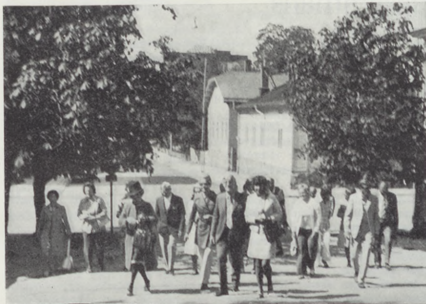
På väg upp till Klosterbackens museum i Åbo.