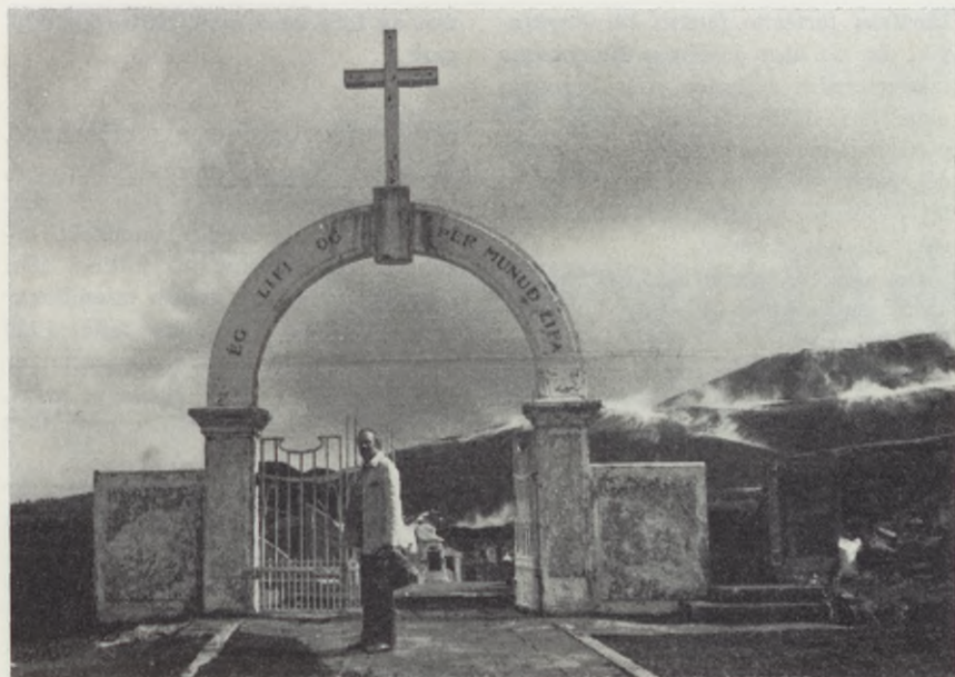
Kyrkogården på Hemön och dess ingång var helt täckta av aska men är nu i tidigare skick igen.