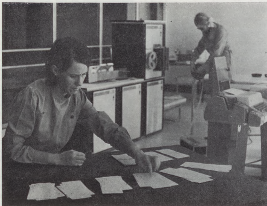
Du registreras och ditt ID-kort programmeras.

Konsekvenserna av dylika till synes obetydliga fel blir ofta större än man