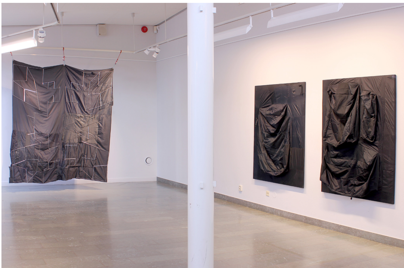
Ultralight structures (Reconstructing umbrellas) Mölnlycke konsthall, Härryda, Oktober 2020