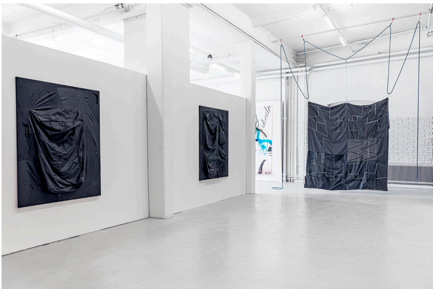
Ultralight structures (Reconstructing umbrellas) 3:e Våningen, Göteborg, Maj 2020