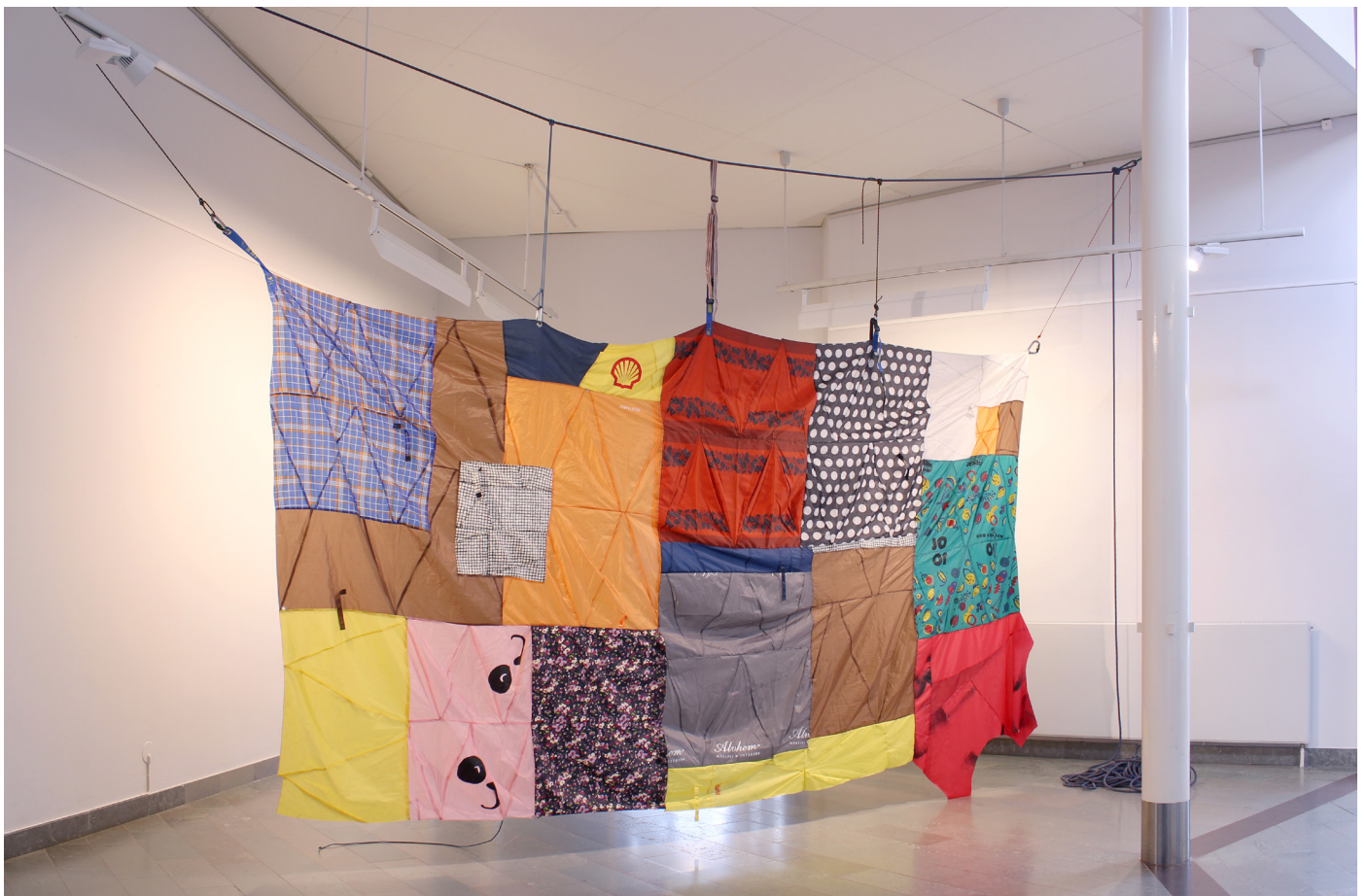
Ultralight structures (Reconstructing umbrellas) Mölnlycke konsthall, Härryda, Oktober 2020