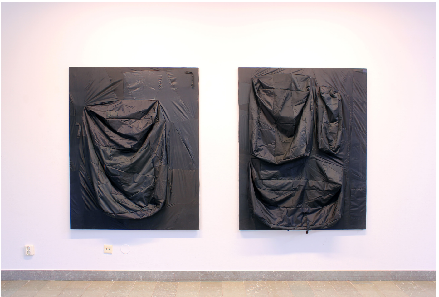
Ultralight structures (Reconstructing umbrellas) Mölnlycke konsthall, Härryda, Oktober 2020