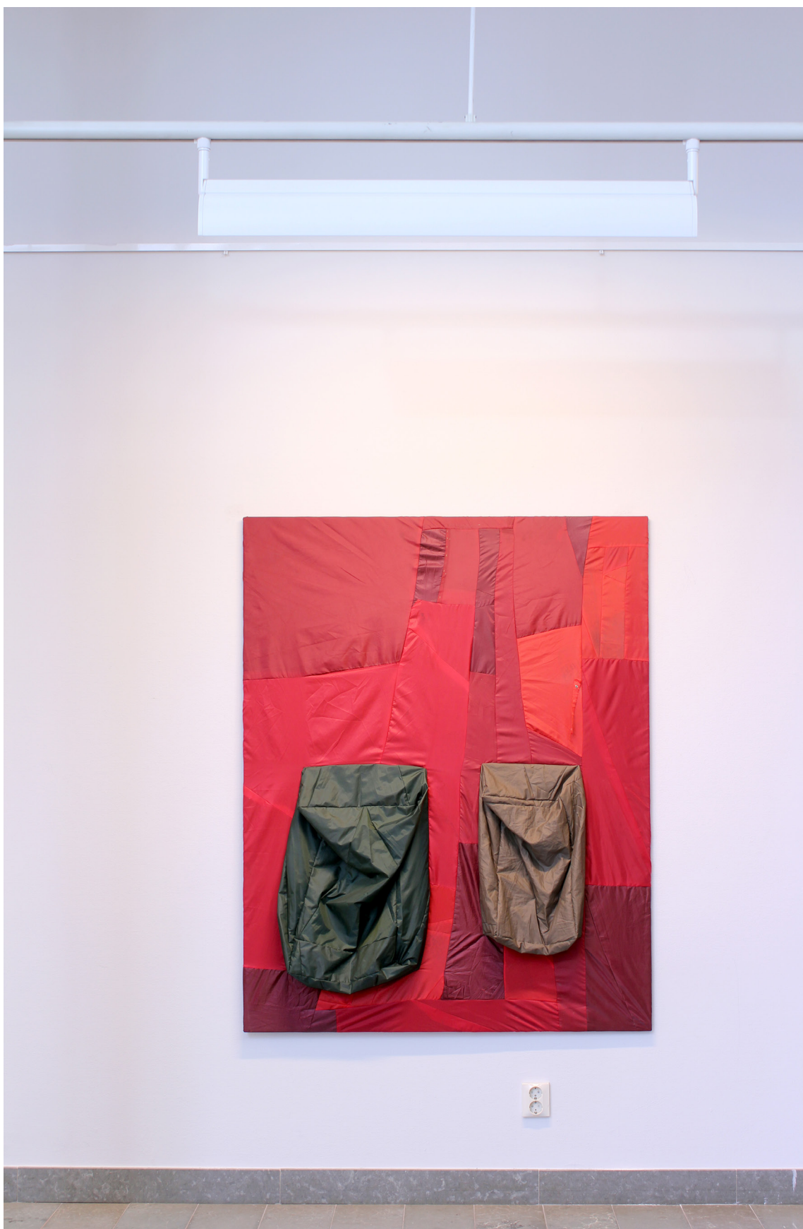
Ultralight structures (Reconstructing umbrellas) Mölnlycke konsthall, Härryda, Oktober 2020