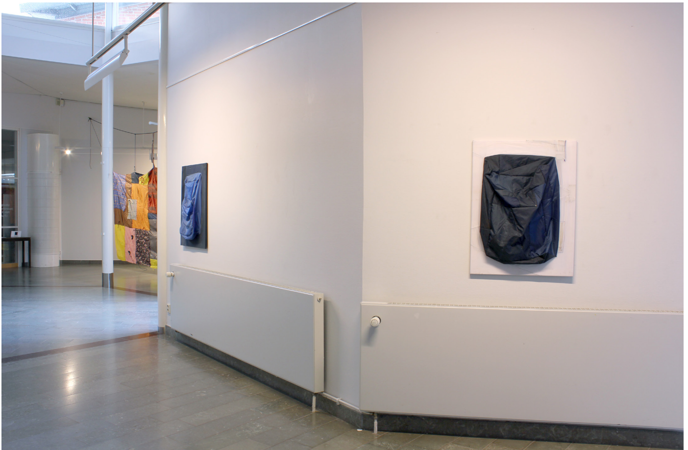
Ultralight structures (Reconstructing umbrellas) Mölnlycke konsthall, Härryda, Oktober 2020