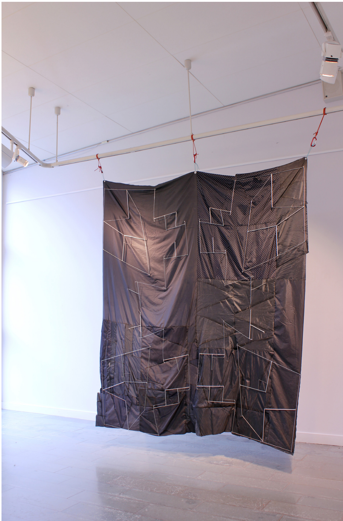
Ultralight structures (Reconstructing umbrellas) Mölnlycke konsthall, Härryda, Oktober 2020