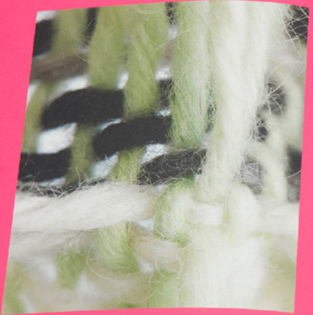
Loviska VI, detalj

ett monokromt gråvitt prov. Varje tråd har behållit sin individualitet men samverkar i en tydligt redovisad konstruktion i hörnen av de mjuka väggarna. Trådarna korsar varandra vid ett större avstånd för varje lager som läggs på. Djupa dialar bildar berastoppar på motsatt sida. Mörkret längst ner påminner om en lättbesjätt megastad med klassiskt gatuplan i rutnet där skyskraporna står så tätt ihop att gatorna har flyttats till hustopparna och kvar på marknivå är skuggiga trånga innergårdar. Ett annat prov med oregelbunden svart och vit varo som i tunt svart inslag bjuder på en annan upplevelse, en känsla av fessad. En rytmisk lek med ljus och skugga med en stark vertikal riktning. De tunna inslagstrådarna blir som delikata detaljer på den kompakta kroppen. Ett tredje prov är så kraftig filat i efterbehandlingen att det gröva stycket har tagit en organisk, nästan primitiv, form. Ytan för tankarna till en lerhydd under konstruktion där väggarna knådas fram av handens kraft och fingrarna har lämnat spår efter sig i den halmblandade leran som ger väggen sin skiftande yta.