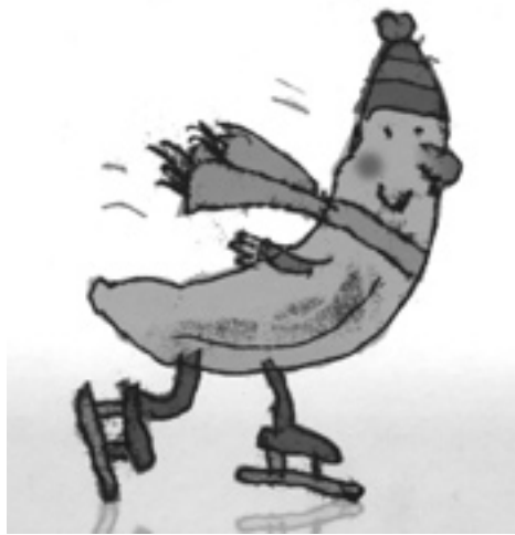
Lasse Åberg: "En skridskobanan på skridskobanan", utgiven av Brombergs Bokförlag, 2003. © Lasse Åberg, 2003.

Artikeln behandlar ett pilotförsök med mångtydiga ord, vilket är ett led i att finna effektiva tester för att ta reda på framförallt flerspråkiga elevers kunskaper, dvs. elever med annat modersmål än svenska.